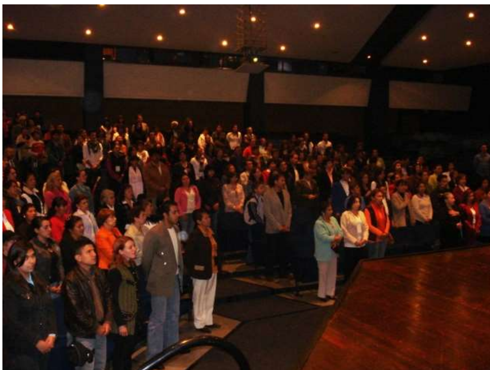
Registro fotográfico. Acto de clausura