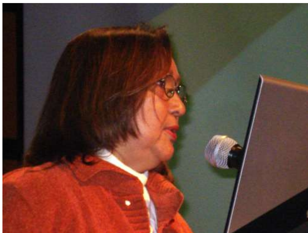
Registro fotográfico. Acto de clausura