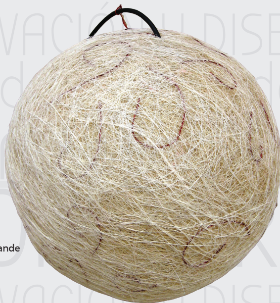
Lámpara triángulos grande