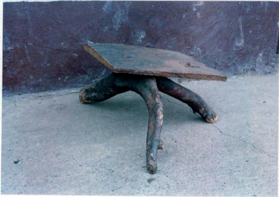
Puesto de trabajo (banco) Vereda Abisinia Municipio de Vélez