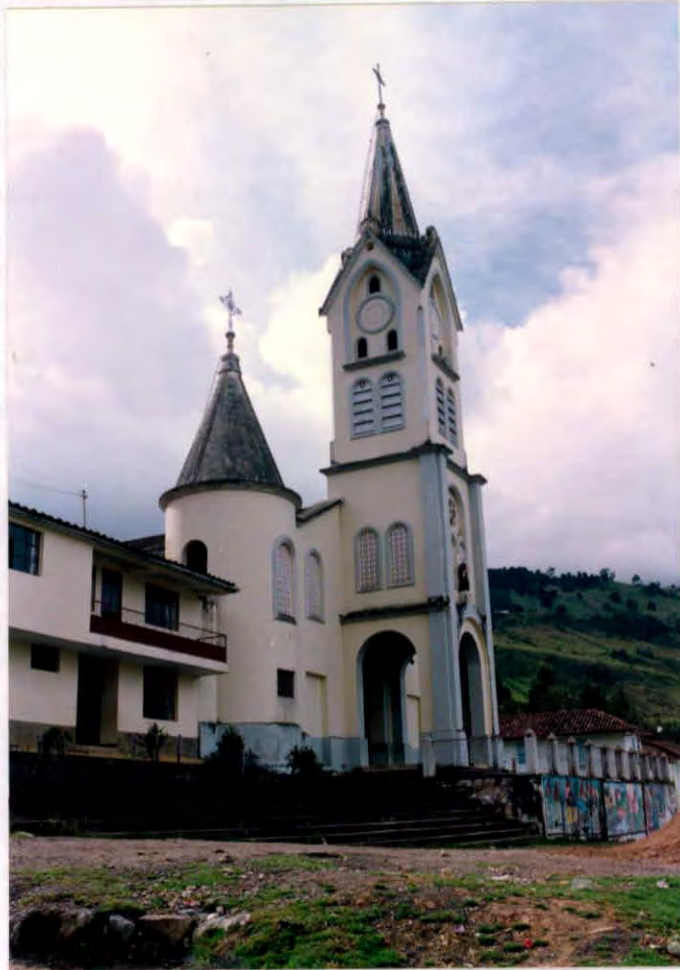
Iglesia Corregimiento Pangote