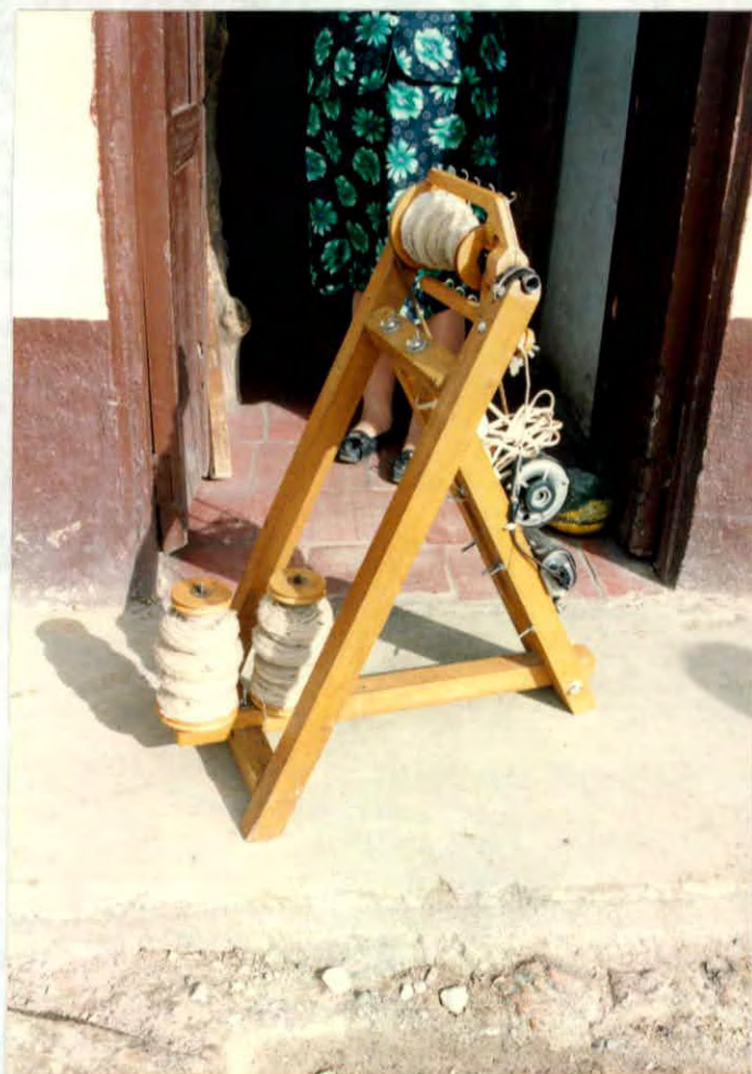
Artefacto con motor para hilado de lana vírgen Municipio de Cerrito