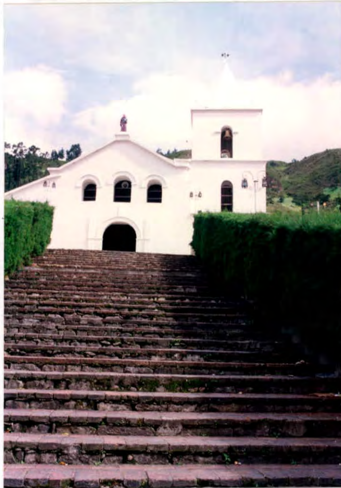
Iglesia Municipio de Cerrito