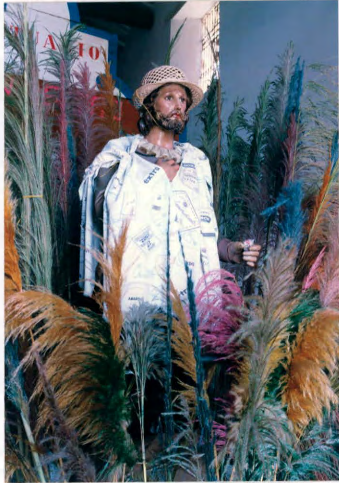
El Santo de los borrachos Municipio de Guavatá