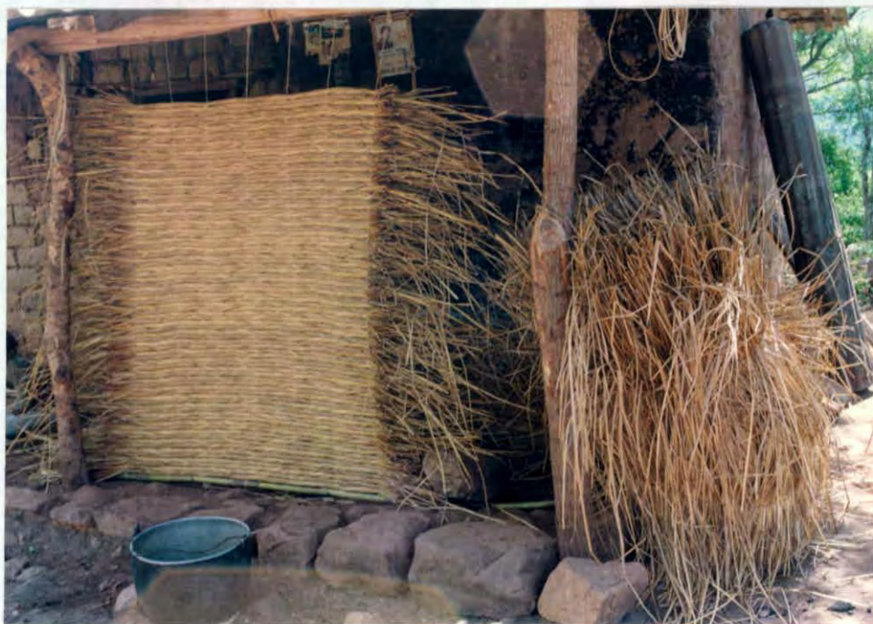
Fabricacion y materia prima para esteras de junco Veredas Mesa Chiquita, municipio Miranda