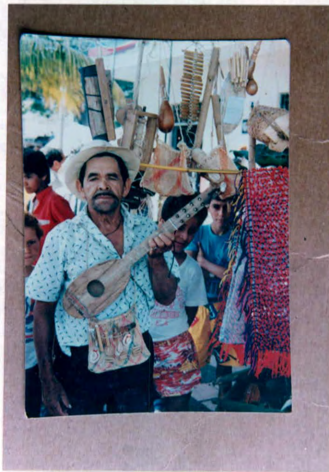
Trovador popular de guabinas y torbellinos Municipio de Vélez