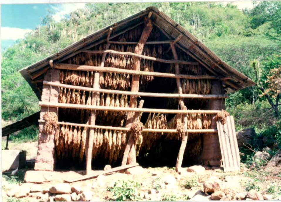
Galpón para secado de tabaco, provincia Garcia Rovira