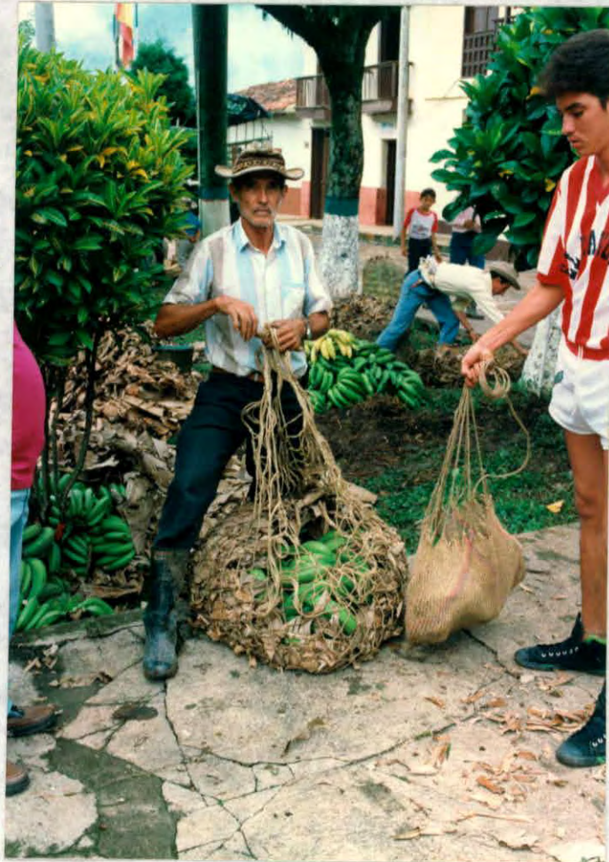
Elementos naturales utilizados para el empaque de productos. (simacota)