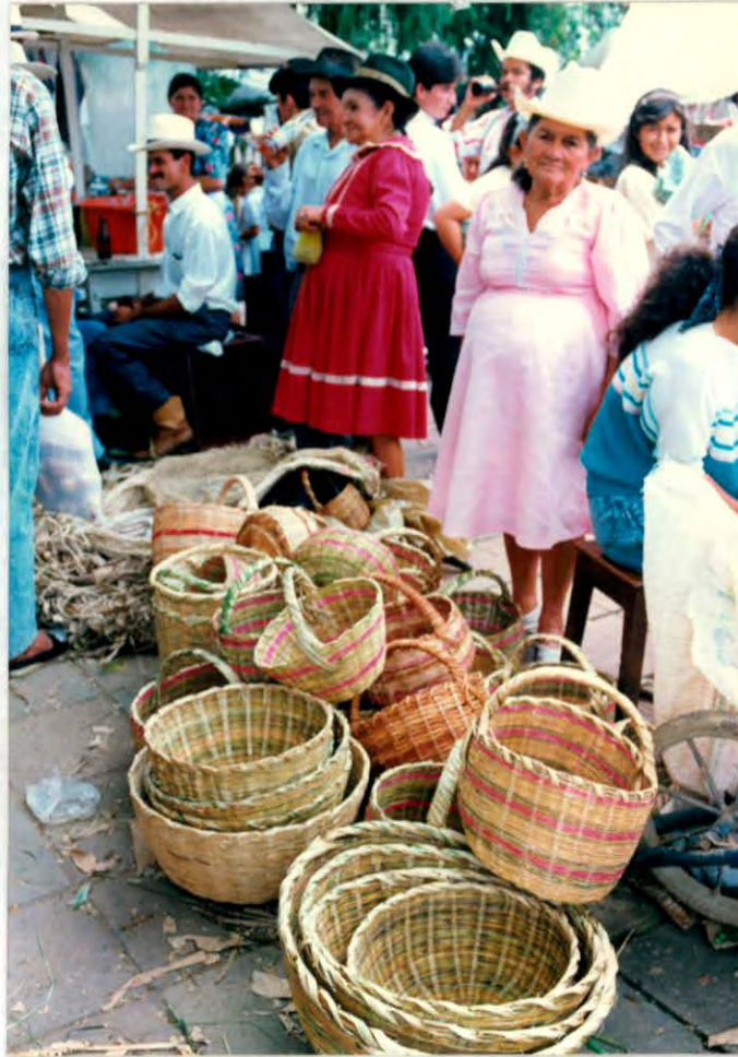
Artesana vendiendo sus productos Municipio de Oiba