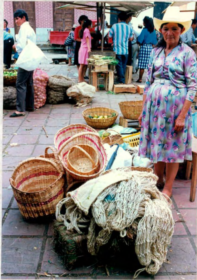
Cestería elaborada por artesanos del municipio de Oiba