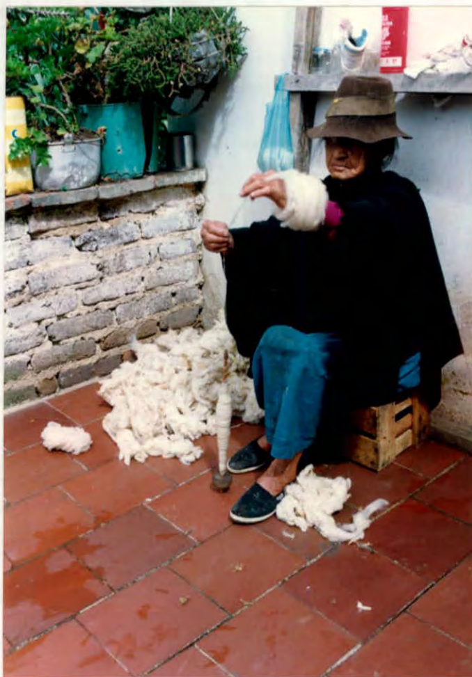
Hilado manual de lana vírgen, con huso, Municipio de Cerrito