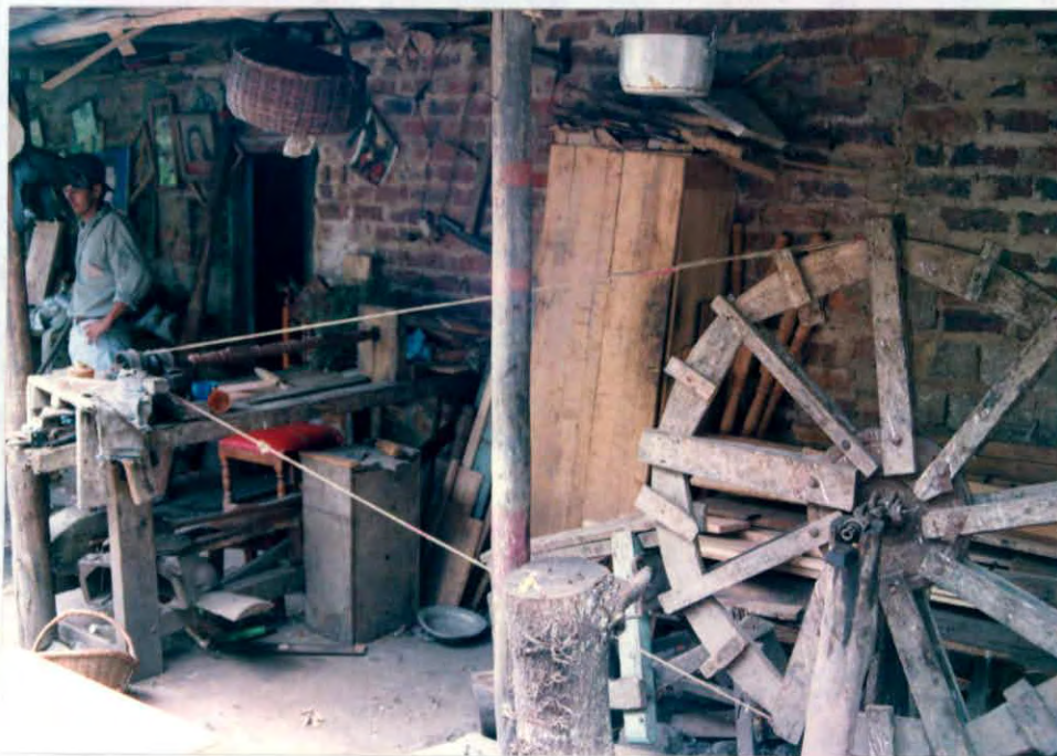
Torno manual de manivela Municipio de Chipatá