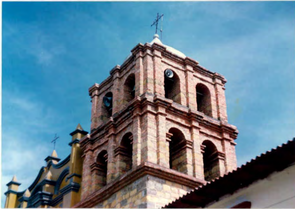
Iglesia Municipio de Guavatá