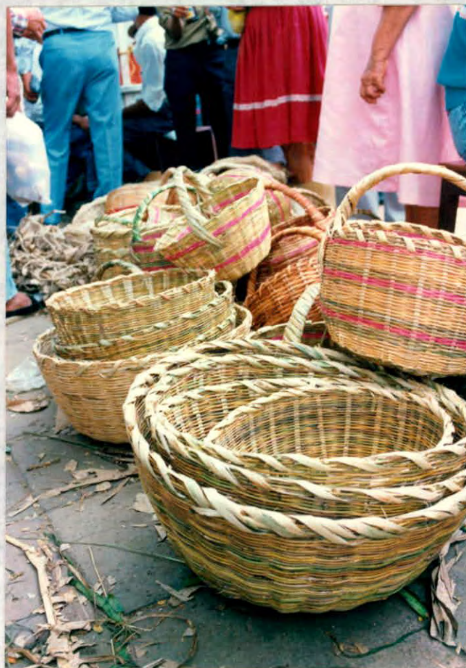
Cestería elaborada por artesanos del municipio de Oiba