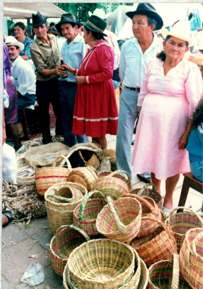
Cestería elaborada por artesanos del municipio de Oiba