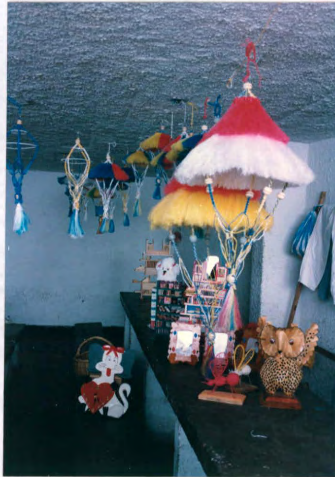
Productos varios, elaborados por internos de la cárcel Municipal de Vélez