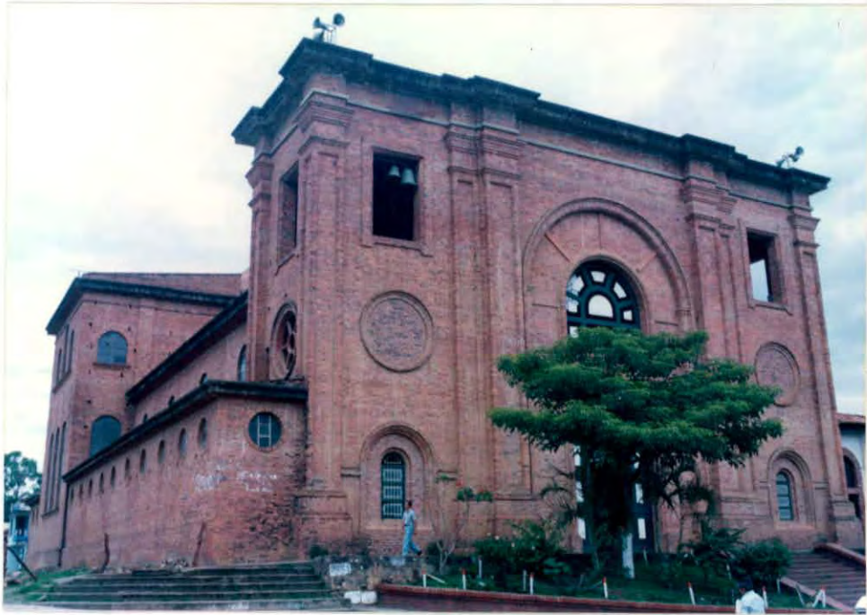
Iglesia Municipio de Puente Nacional