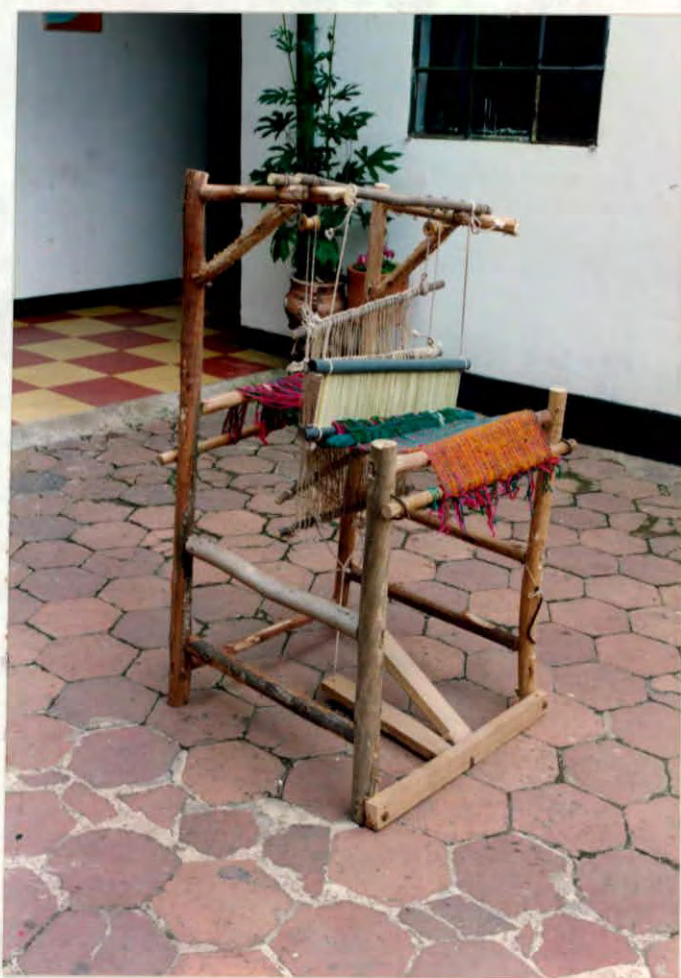
Telar vertical para tejido de cobijas municipio de Cerrito