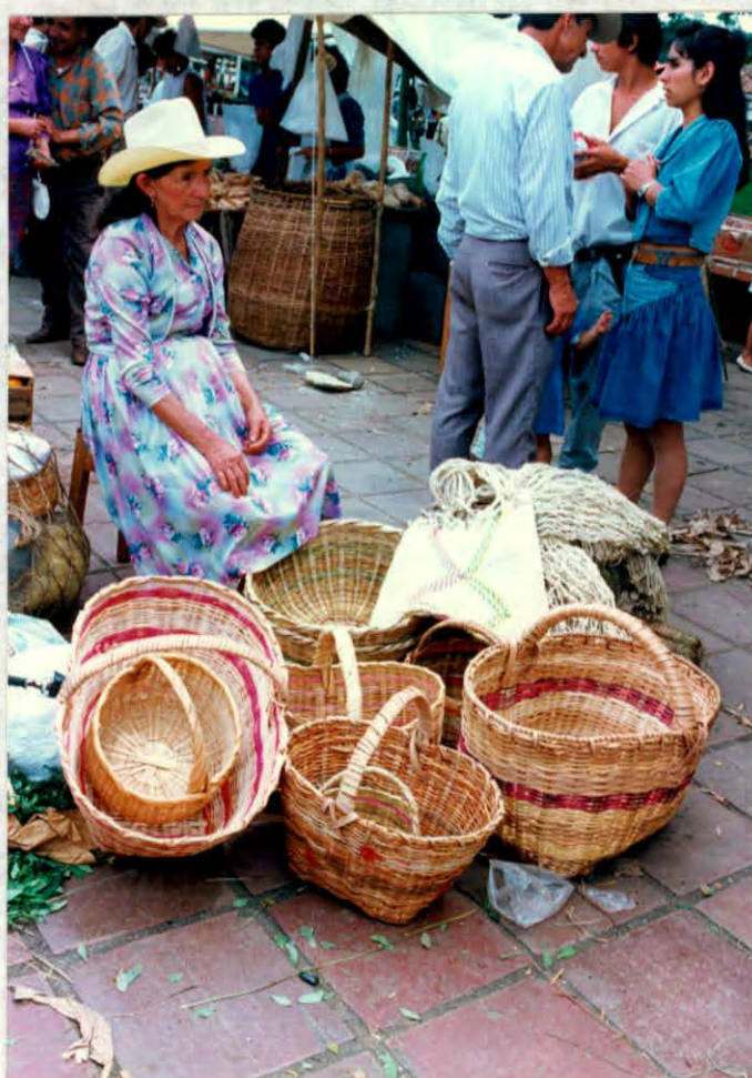
Cestería elaborada por artesanos del municipio de Oiba