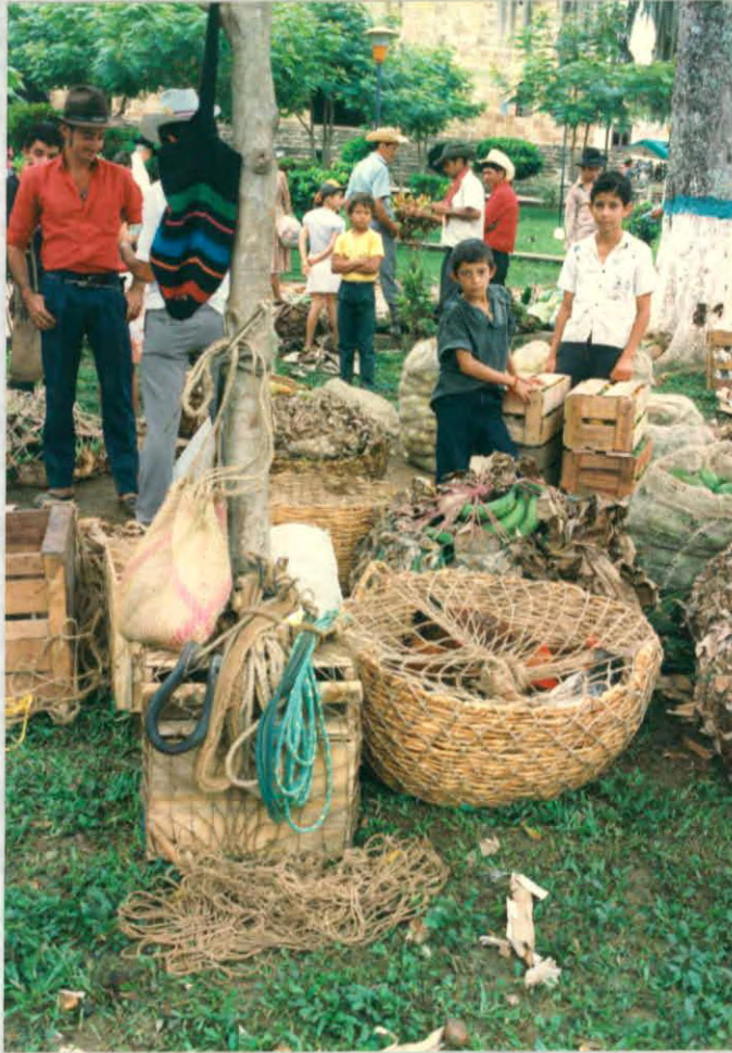
Elementos naturales utilizados para el empaque de productos. (simacota)