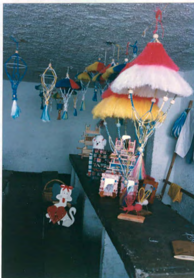
Productos varios, elaborados por internos de la cárcel Municipal de Vélez