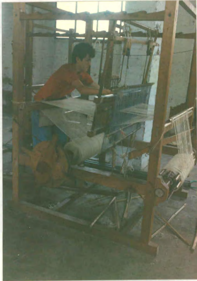
Telar para costales de fique (Municipio de Aratocha)