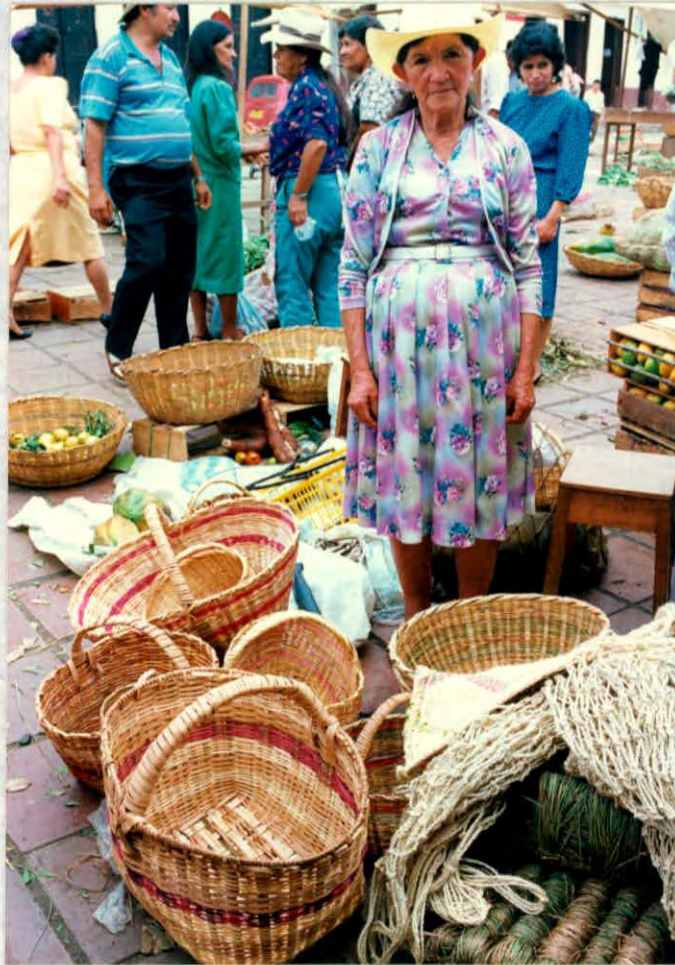
Cestería elaborada por artesanos del municipio de Oiba