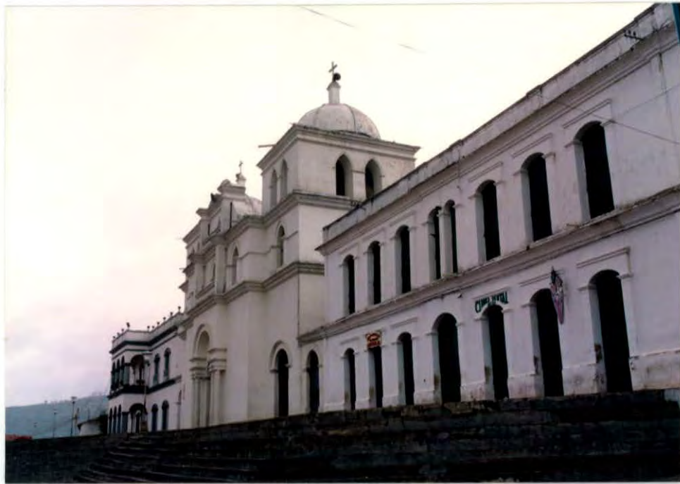
Iglesia del municipio de Guaca