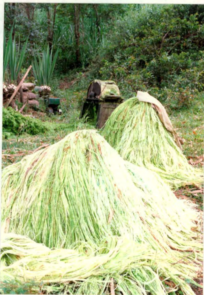
Fique desfriado y sin lavar, Municipio Aratoca