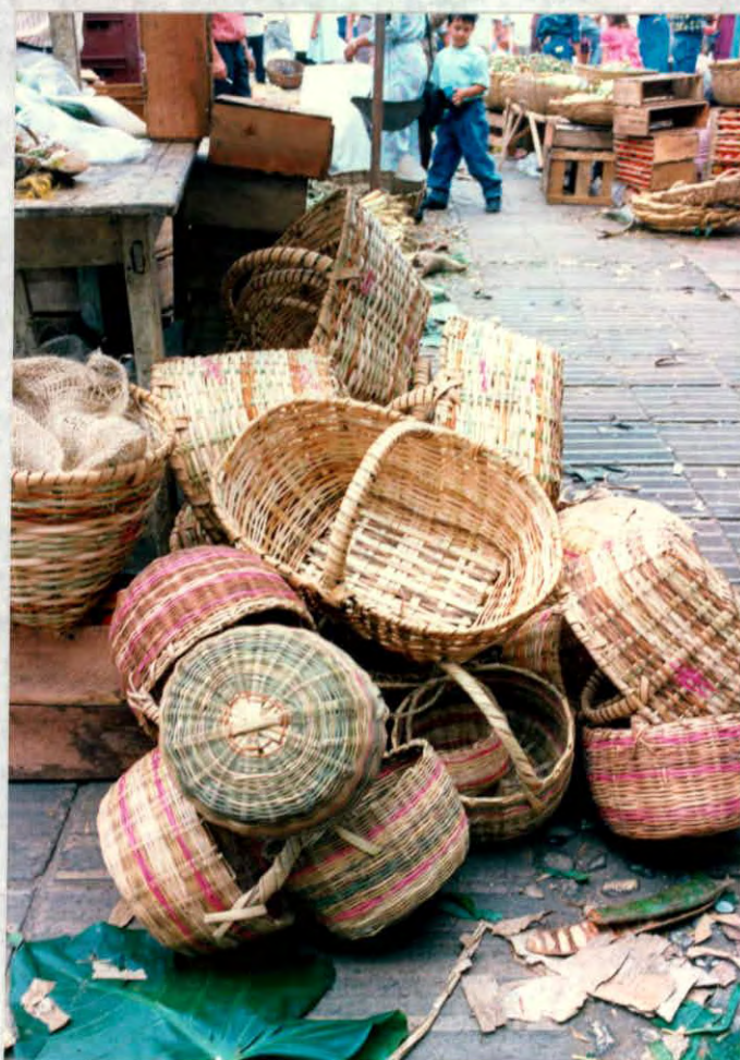
Cestería elaborada por artesanos del municipio de Oiba