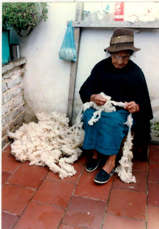
Desenredado de lana virgen para hilado manual Municipio Cerrito