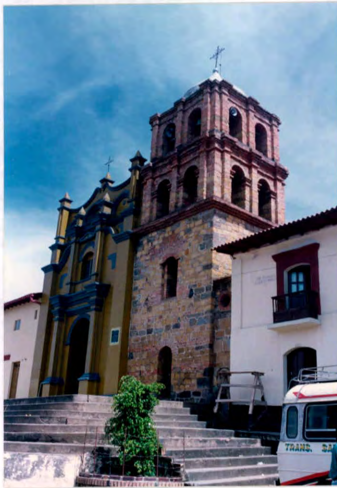
Detalle de Iglesia Municipio de Guavatá