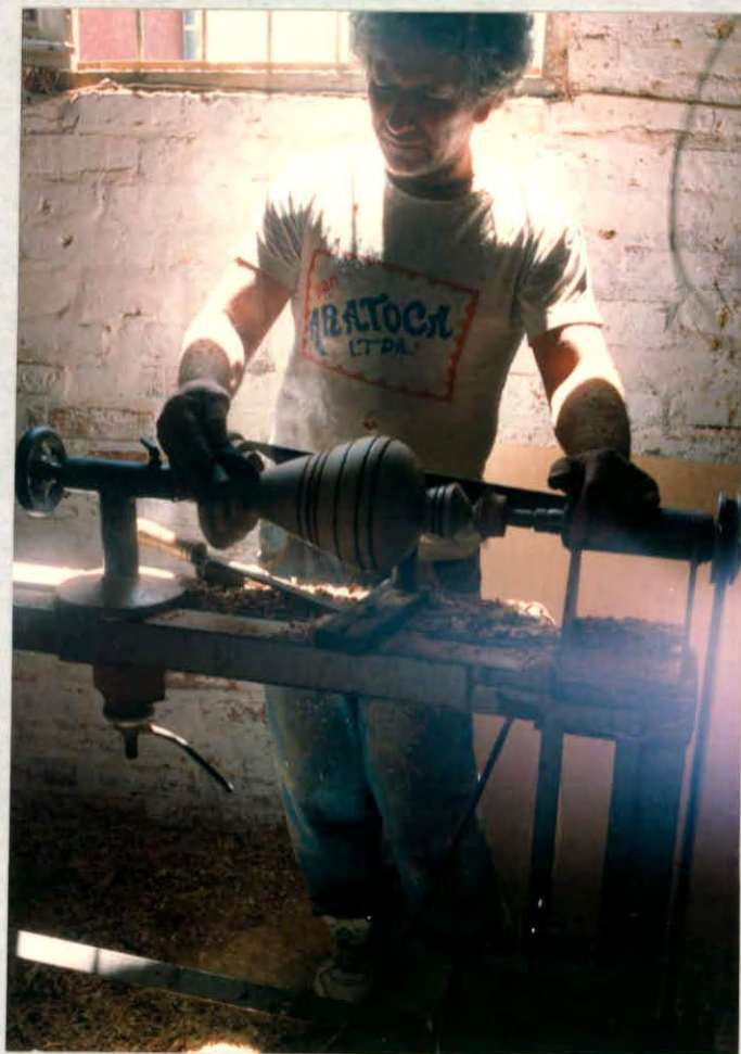
Torneado de una base para lámpara en forma de trompo (Aratocha)