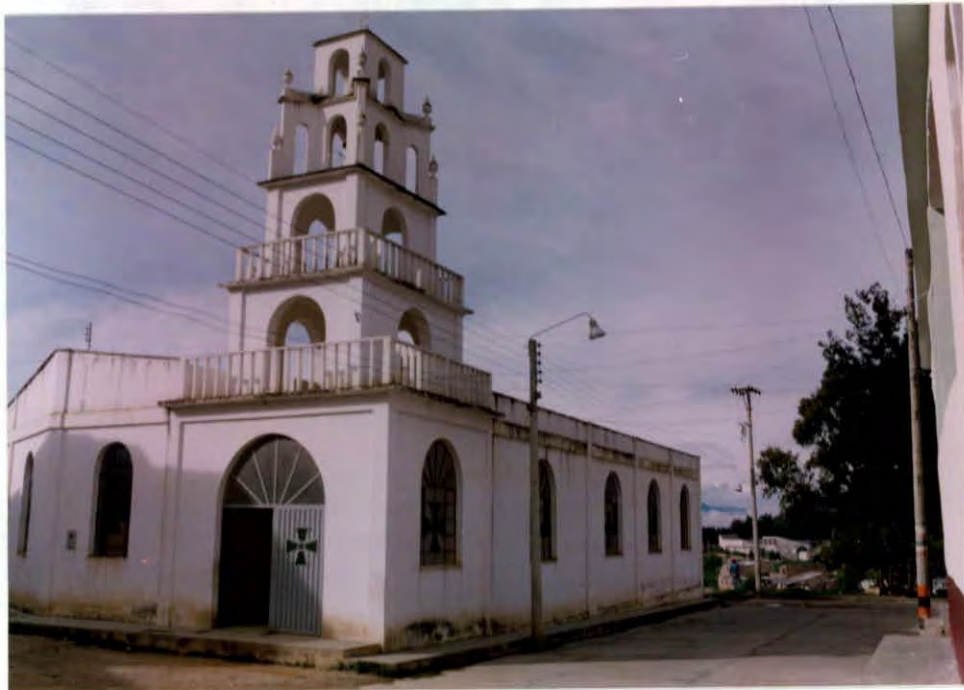
Iglesia Municipio de Málaga