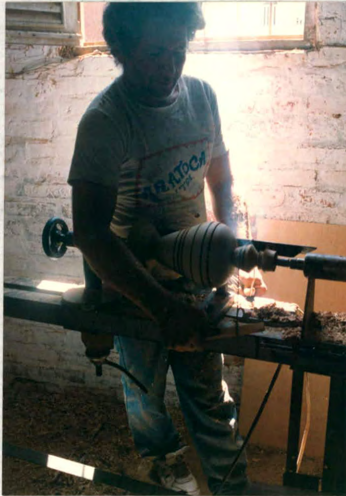
Torneado de una base para lámpara en forma de trompo (Aratocha)