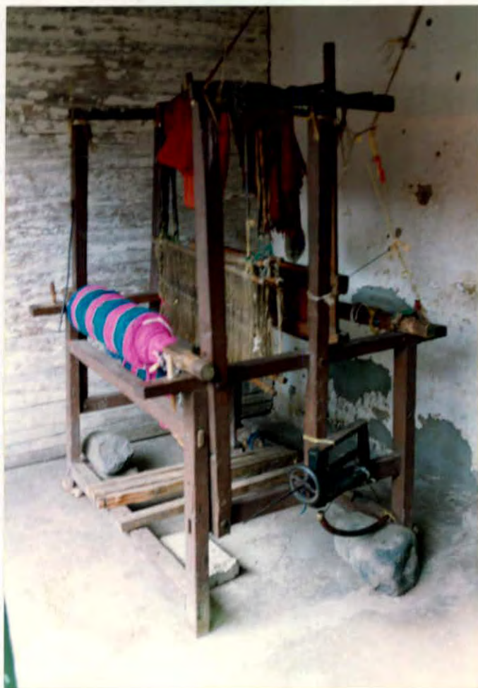
Telar vertical y torno manual utilizados en la fabricación de ruanas y cobijas, Municipio de Cerrito