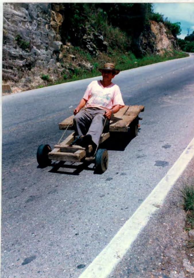
Medio de transporte para leña Municipio de Aratocha