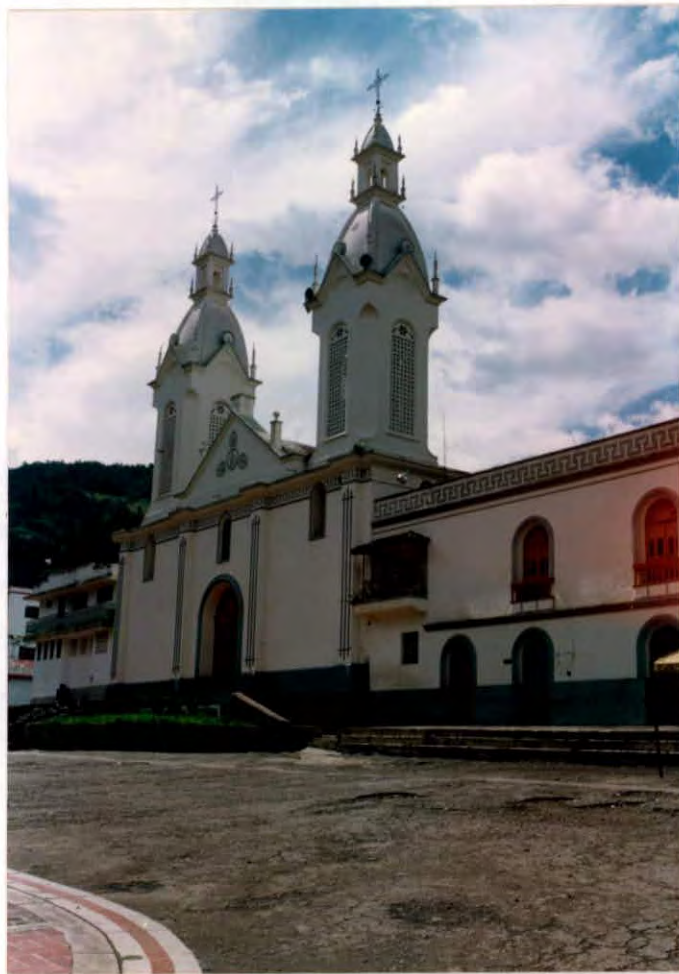
Iglesia Municipio de San Andrés