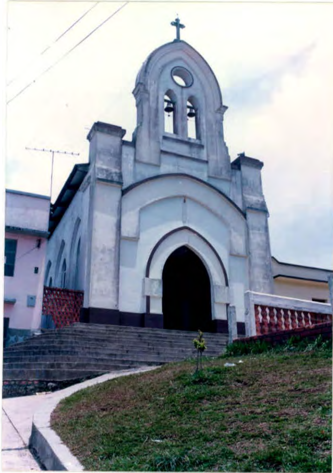
Iglesia Municipio de Landázuri