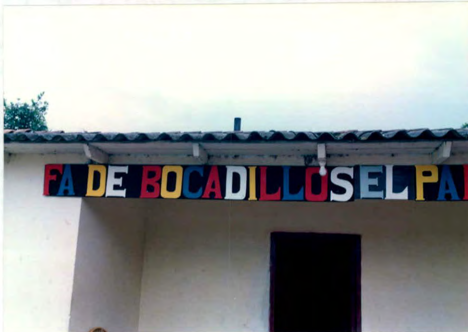
Típico anuncio de una fábrica de bocadillos municipio de Vélez