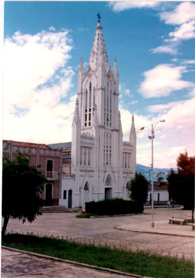
Iglesia del Municipio de Miranda