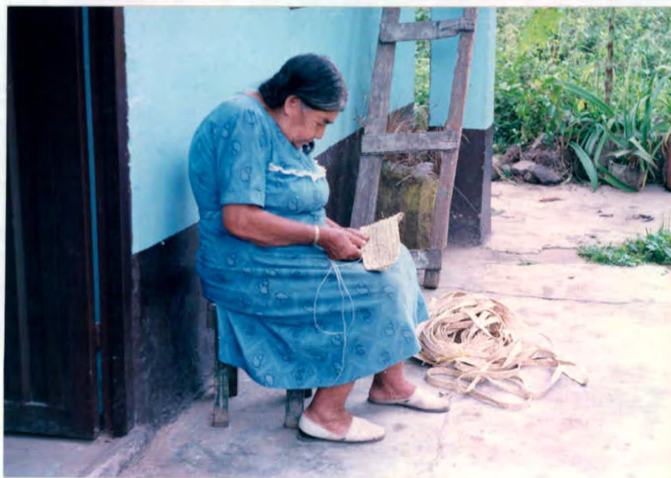
Tejido de crineja para elaborar sombreros Municipio de Cimitarra