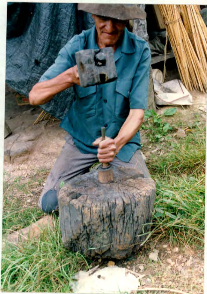
Apisonado de tierra para la fabricación de cohetes y voladores vereda Pescaderito, Municipio de Málaga