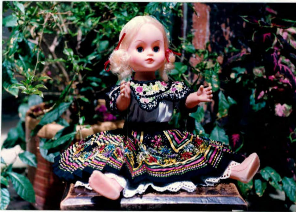
Vestido de muñeca con traje típico Municipio de Vélez