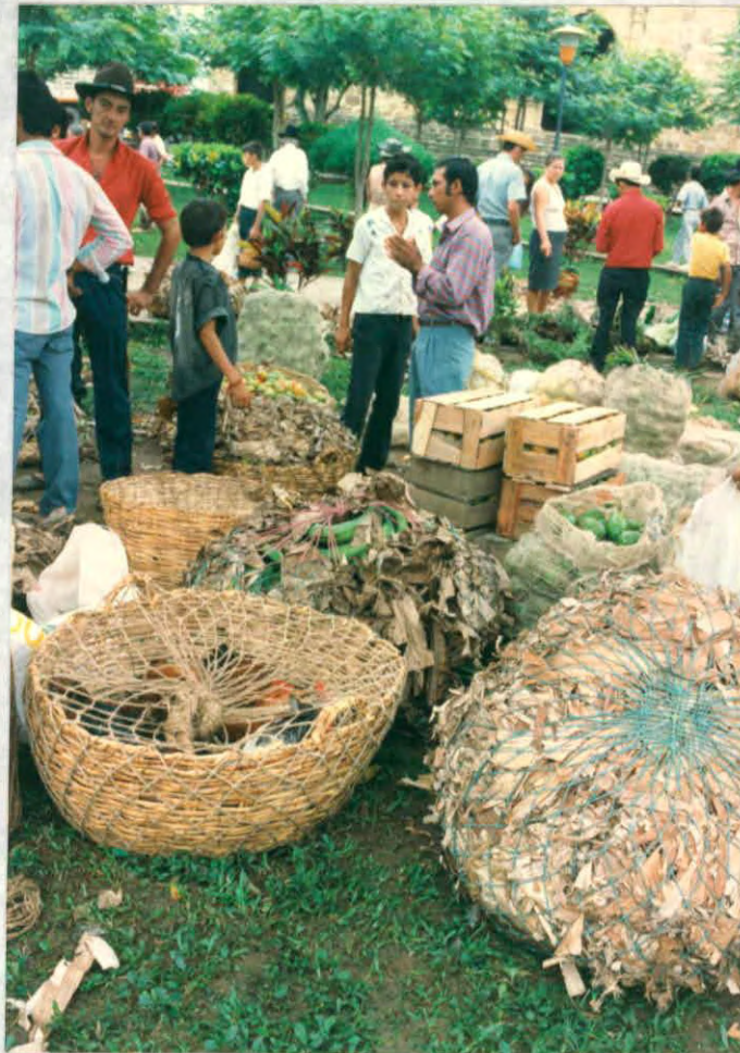
Elementos naturales utilizados para el empaque de productos. (simacota)