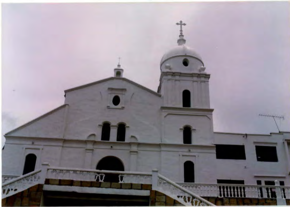
Iglesia Municipio de Molagavita