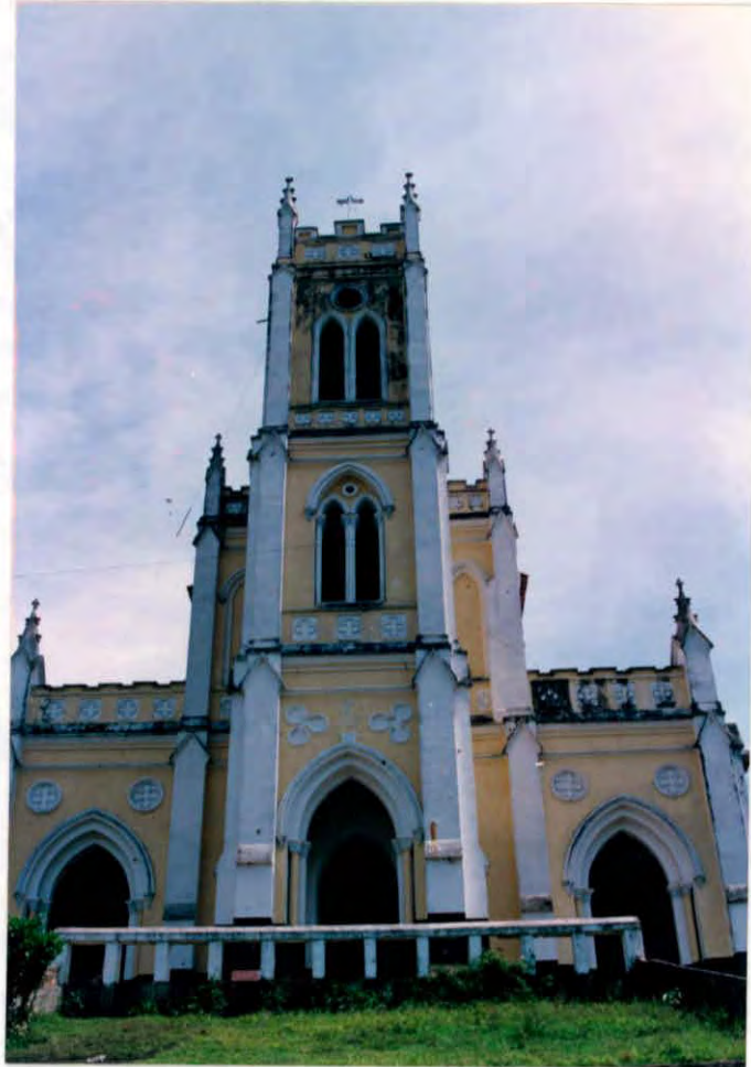
Iglesia Municipio de Chipatá