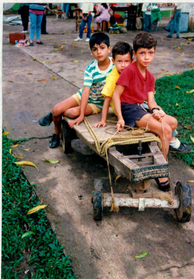
Medio de transporte para mercado Municipio de Simacota