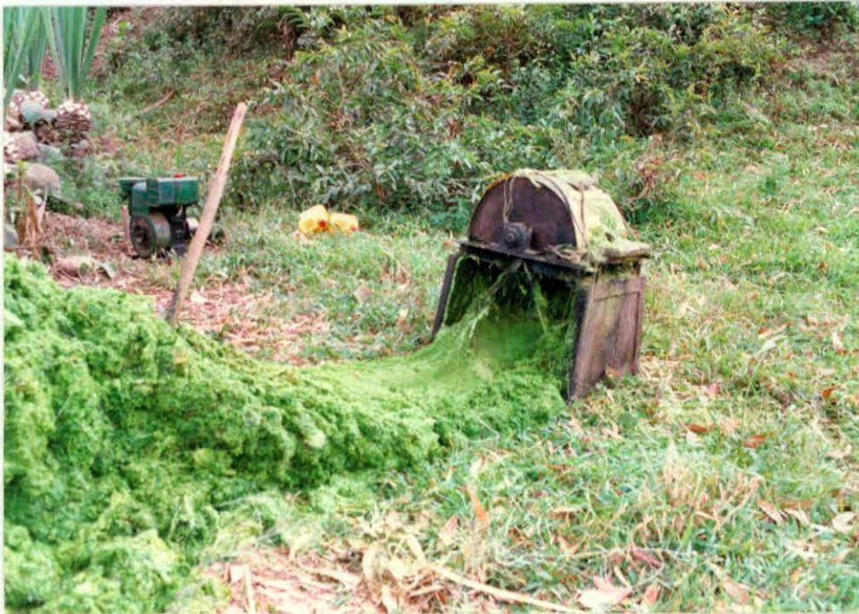
Máquina desfribadora de figue, Municipio Aratoca