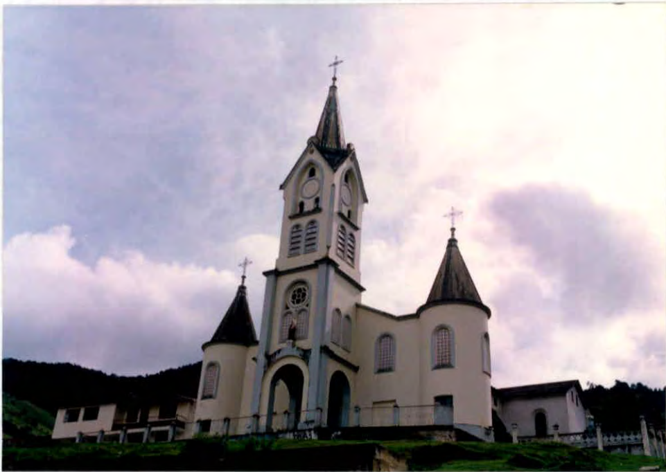
Iglesia Corregimiento Pangote