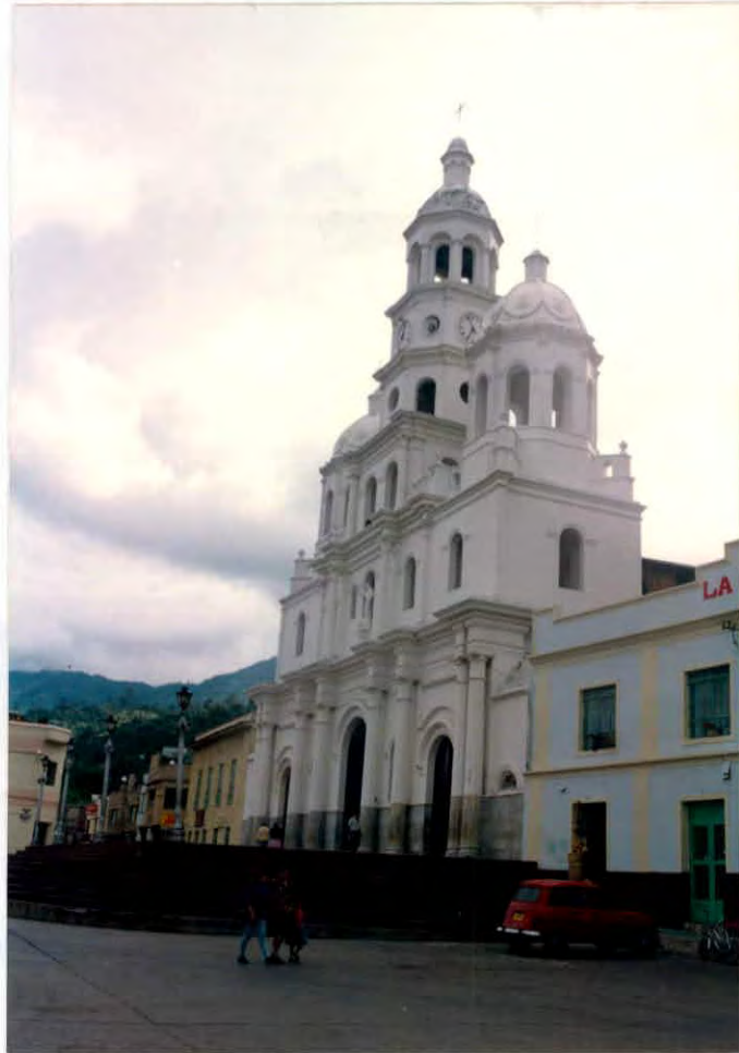
Catedral del Municipio de Málaga