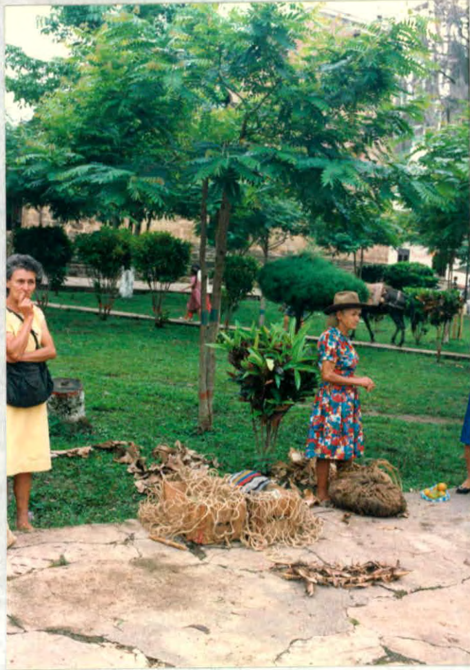
Elementos naturales utilizados para el empaque de productos. (simacota)