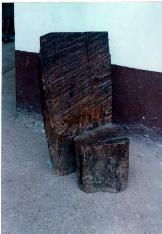
Puesto de trabajo (banco ) Vereda Abisinia Municipio de Vélez