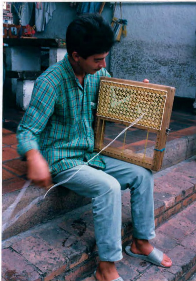
Tejido manual con marco Cárcel Municipal de Vélez