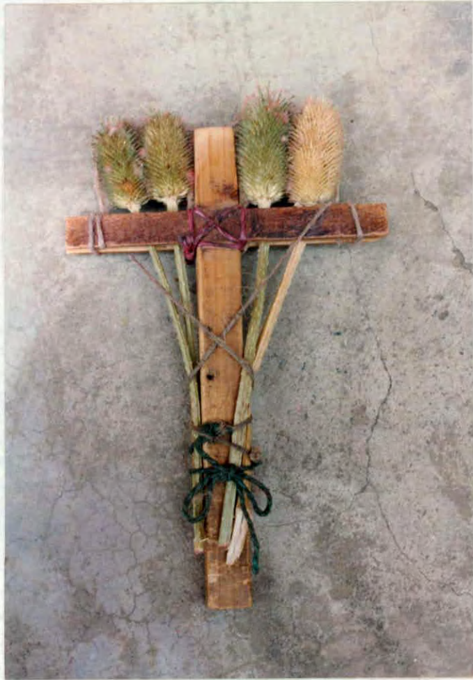
Cardador de lana virgen con connotación religiosa Municipio de credito