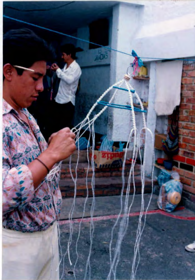
Tejido manual con nudos, Internos Cárcel Municipal de Vélez