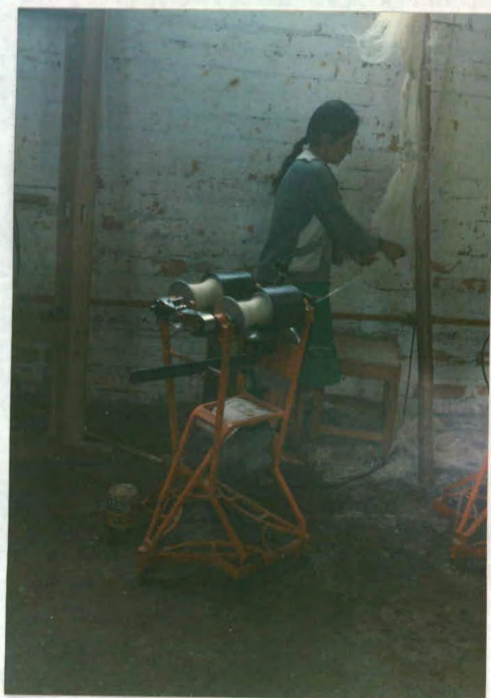
Torno para hilado de fique, solución mecánica de creación colectiva, (Municipio de Aratoca)