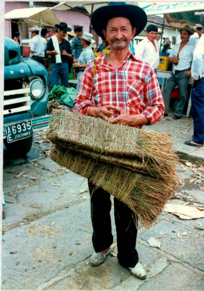
Fibra natural (Chusque), para la fabricación de enjalmas, (Oiba)