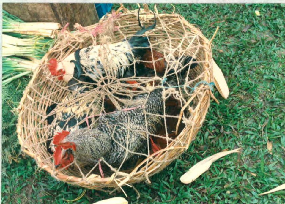
Elementos naturales utilizados para el empaque de productos. (simacota)