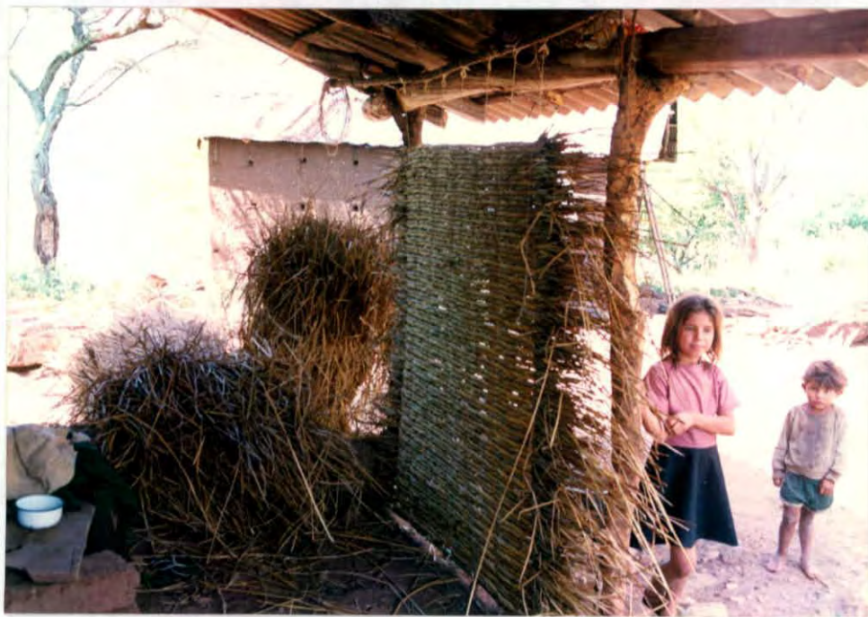
Telar y materia prima (junco) para elaborar esteras Vereda Mesa Chiquita, Municipio de Miranda