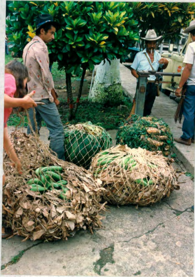
Elementos naturales utilizados para el empaque de productos. (simacota)