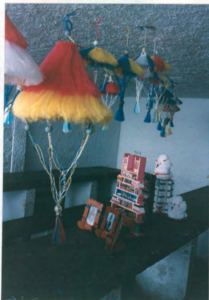
Productos varios elaborados por internos de la cárcel Municipal de Vélez