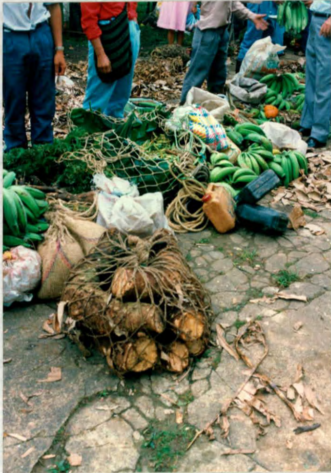
Elementos naturales utilizados para el empaque de productos. (simacota)