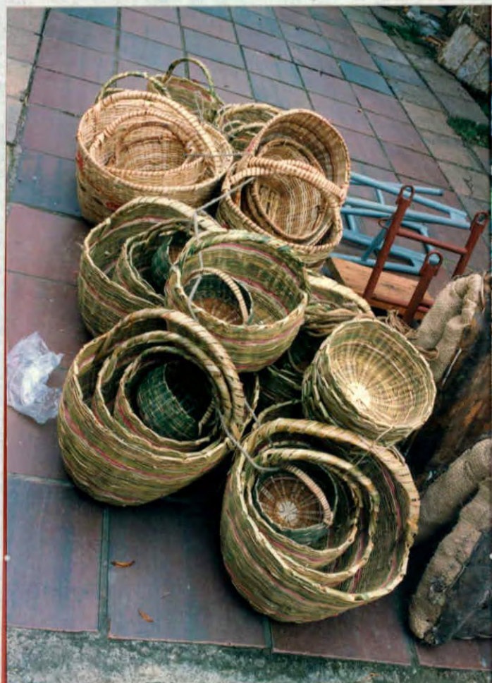
Cestería elaborada por artesanos del municipio de Oiba