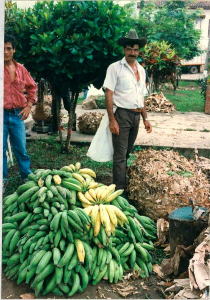
Elementos naturales utilizados para el empaque de productos. (simacota)