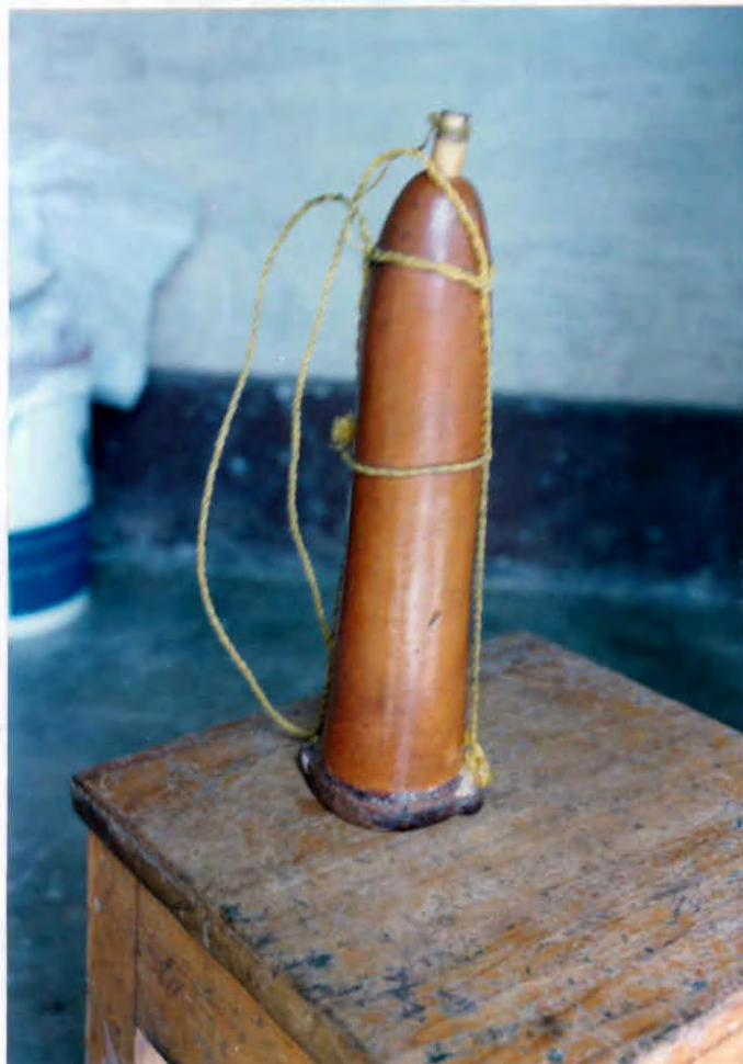
Puro o calabazo utilizado para guardar pólvora Municipio de Cimitarra