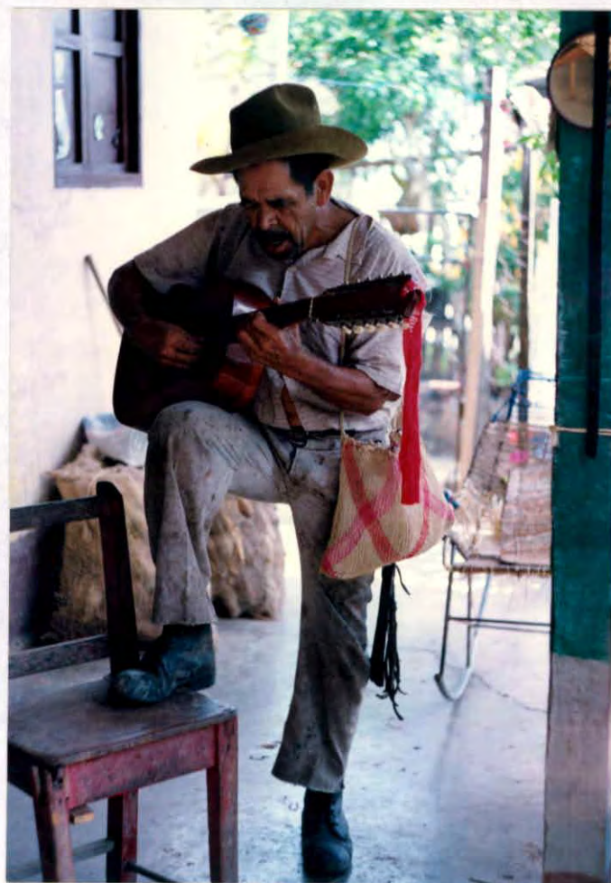
Trovador popular de guabinas y torbellinos Municipio de Vélez