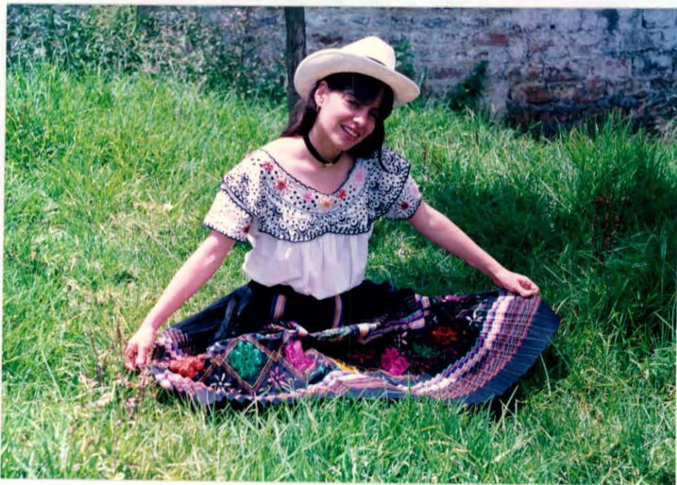
Muchacha con traje típico Municipio de Vélez