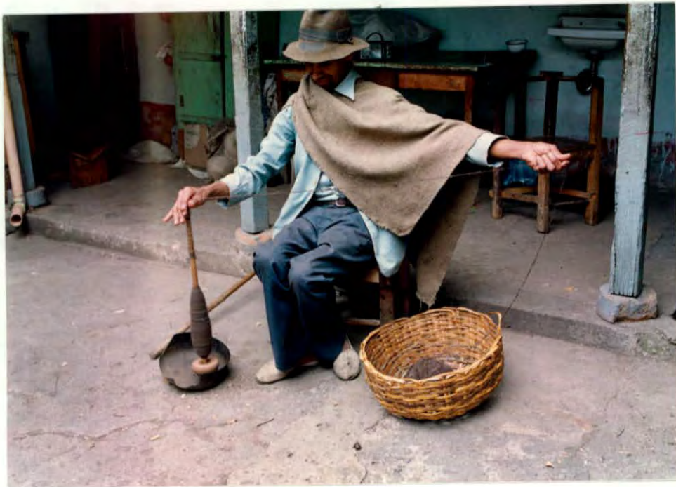
Torcido manual de lana virgen, con huso, Municipio de Cerrito