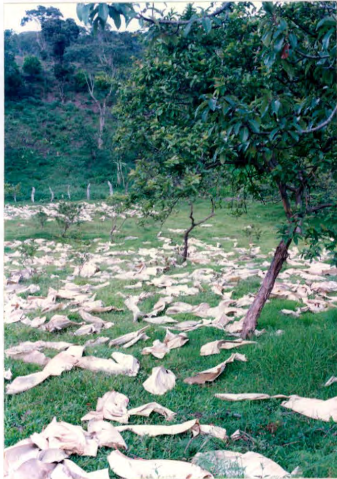
Secado al natural de hoja de bijao para empacar bocadillo Municipio de Vélez