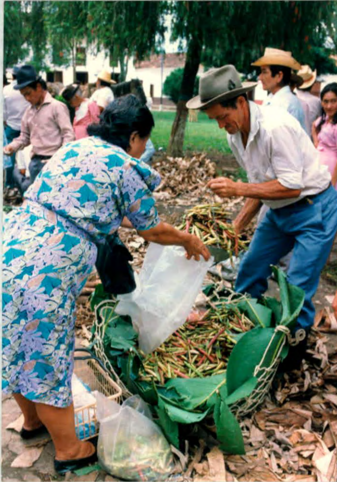
Elementos naturales utilizados para el empaque de productos. (simacota)