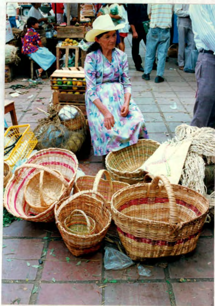
Artesana vendiendo sus productos Municipio de Oiba