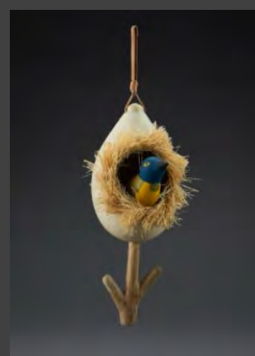
Nido perchero $ 32.000