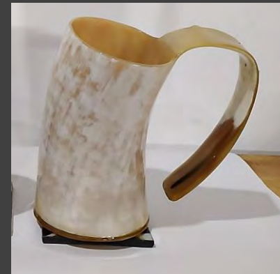
JARRÓN CERVECERO $130.000