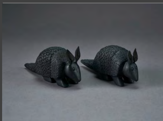
Figura cachicamo mini $ 20.000