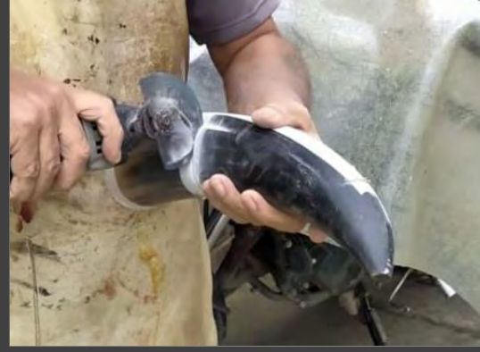
TÉCNICA Laminado, incrustación, modelado