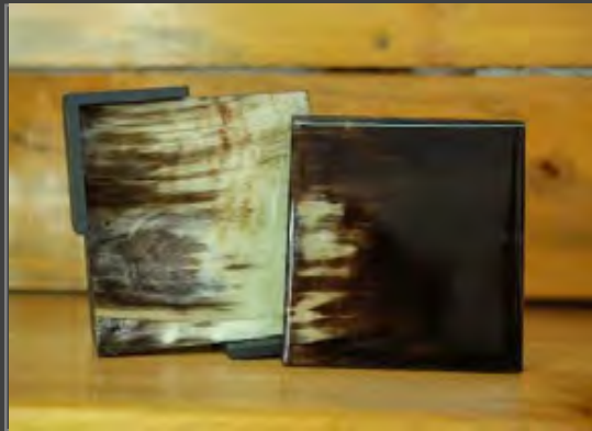
PORTAVASOS X 4 $80.000 - $120.000