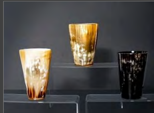
VASOS $100.000 - $70.000 - $80.000