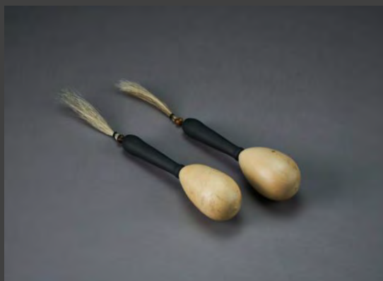
Maraca Ariporeña $ 30.000