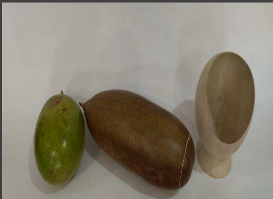
MATERIA PRIMA Totumo, madera