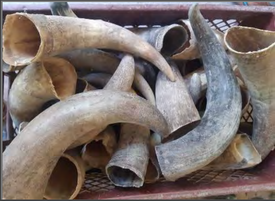
MATERIA PRIMA Cacho