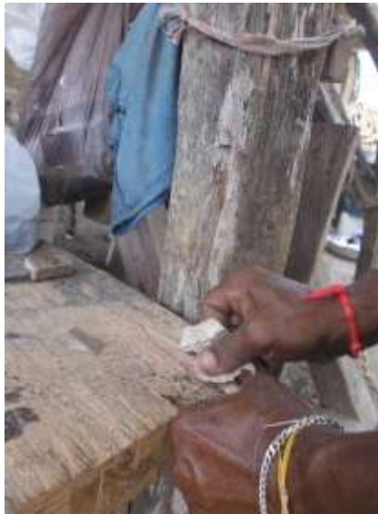
MAPA DE PROCESO Oficio artesanal: Carpintería Técnica: Talla de la madera