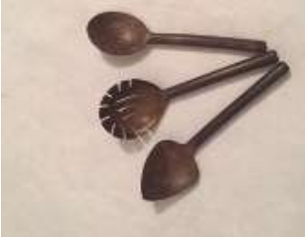
Imagen29 Juego Cucharones Cartagena. talla en coco 4 Noviembre 2016