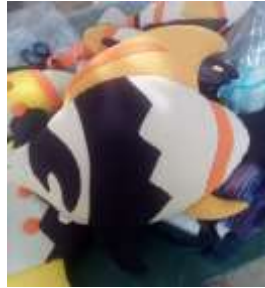
Imagen 14 Revisión producto Cartagena-aplicación tela 12 Octubre 2016