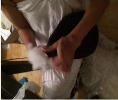
Imagen 19 proceso de relleno Cartagena D.C y T- Aplicación Tela 6 octubre 2016