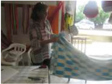
Imagen 15 Revisión de producto San Jacinto 12 octubre 2016