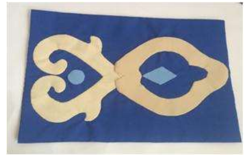
Imagen37 Individuales Cartagena aplicación en tela 4 Noviembre 2016 Fotógrafo: Isabel Rodríguez Artesanías de Colombia