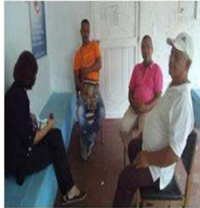
Imagen 26 Charla manual de uso Cartagena talla coco 29 Septiembre 2016