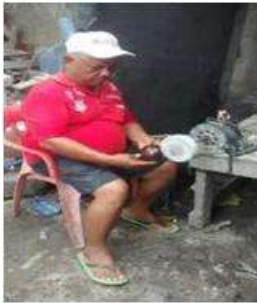
Imagen 17 proceso de pulimiento Cartagena D.C y T- Talla en coco 6 Octubre 2016