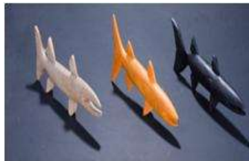
Imagen 42 Barracudas Baru Noviembre 2016 Fotógrafo: Isabel Rodríguez Artesanías de Colombia