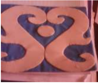
Imagen 13 Revisión producto Cartagena-aplicación tela 12 Octubre 2016 Fotógrafo: Isabel Rodríguez Artesanías de Colombia