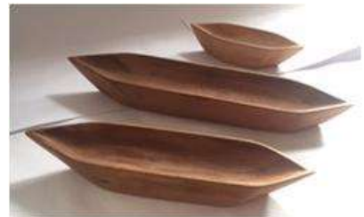
Imagen 43 Juego Canoas Baru Noviembre 2016

Se Enviaron a Expoartesanas 2016 Aproximadamente 395 Productos de las diferentes comunidades.