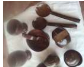
Imagen 12 Revisión de producto Cartagena D.C y T- Talla en coco 27 octubre 2016