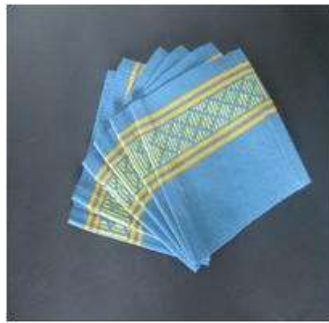
Imagen36 Portavasos labrados San Jacinto 4 Noviembre 2016