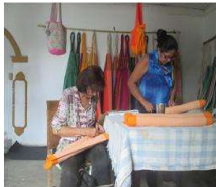
Imagen 6 Acompañamiento empaque San jacinto 25 Octubre 2016