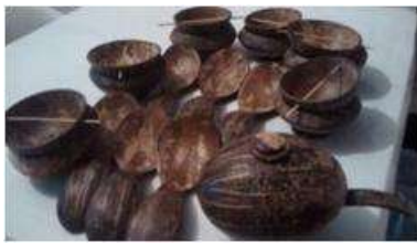
Imagen 11 Revisión de producto Cartagena D.C y T- Talla en coco 27 octubre 2016