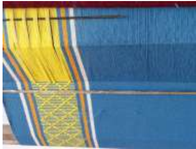
Imagen 16 Revisión de producto San Jacinto 12 octubre 2016