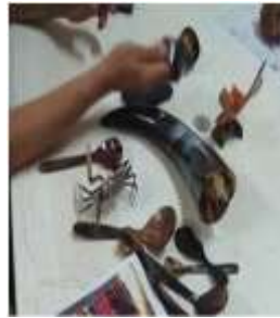
Imagen 18 proceso de corte Cartagena D.C y T- Talla en cacho 6 octubre 2016