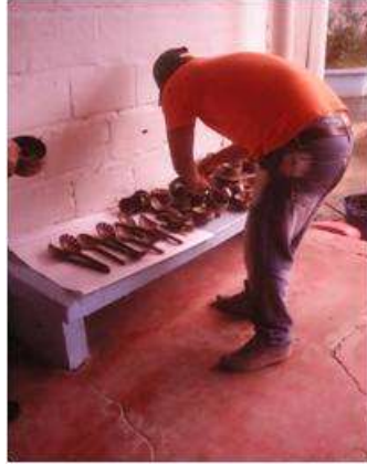
Imagen 4. proceso de empaque Cartagena D.C y T- talla coco 2 Noviembre 2016