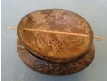
Imagen30 Colador Cartagena. talla en coco 4 Noviembre 2016