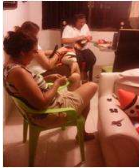
Imagen 20 proceso de costura Cartagena D.C y T- Aplicación Tela 6 octubre 2016