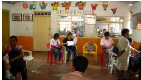
Fotografía N° 7,8,9 Y 10 Reunión Grupo Cabildo Nassa Centro Cultural Brisas de Mayo, Primer día de Capacitación.

Cali – Valle del Cauca – 24 de Septiembre de 2010, Artesanías de Colombia S.A.