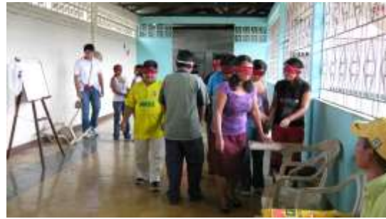
Fotografía N° 5 y 6 Reunión Grupo Cabildo Joaquincito del Rio Naya Pastoral Social , Primer día de Capacitación. Cali – Valle del Cauca – 20 de Septiembre de 2010, Artesanías de Colombia S.A.

El 21 de Septiembre, se presentó el equipo de diseño a los beneficiarios de Aciva para iniciar procesos de diseño de producto.