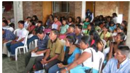
Fotografía N° 1 y 2 Reunión Sede ACIVA , Socialización y Sensibilización, Primer día de Capacitación.