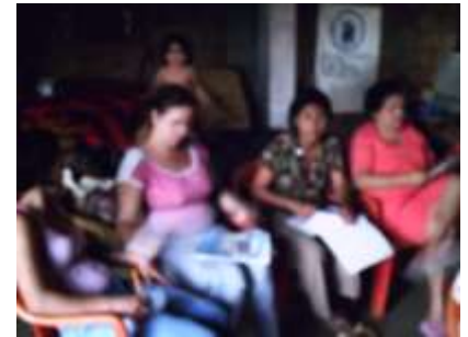
Fotografía N° 11, 12, 13, 14,15,y16 Reunión Grupo Saetas de Fuego , Socialización y Levantamiento de línea Base.