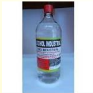
Materiales Campohermoso, Octubre 2016

Materiales: Alcohol industrial y anilinas