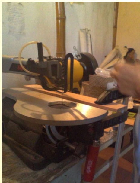
Sierra con guía

Se cortan las piezas de madera con la sierra colocando una guía de manera que todas queden con los cortes rectos , posteriormente se lijan muy bien procurando que sus orillos estén perfectamente lisos y rectos de modo que casen las piezas entre sí. Teniendo en cuenta que una pieza va la beta en el sentido oriental y pieza que se adhiere va en el sentido vertical