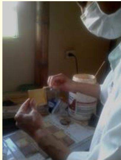
Pegando las piezas

Luego se pegan los cuadros aplicando en ambos orillos el Carpincol se unen si aparece una luz entre cuadro y cuadro se aplica aserrín con Carpincol esta mezcla rellena y cubre la separación