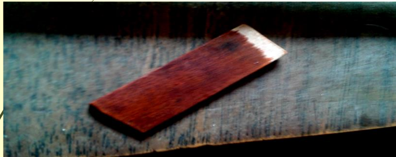
APLICANDO el color Campohermoso, Octubre 2016

Se disuelven de 5 a 10gr de anilinas en 100ml de alcohol de pendiendo la concentración de color que se desee, se mezcla y se agita muy bien, y se aplica con un trapo, se puede aplicar varias veces, seca muy rápido