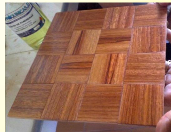
MUESTRAS Campohermoso, Octubre 2016 – Foto por Constanza Arévalo Corpochivor – Artesanías de Colombia