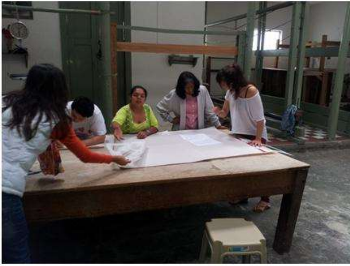
Foto capacitación patronaje y telar horizontal Tomada por: Gloria Duque Salamina, Caldas- febrero 13- 14 de 2013 Artesanías de Colombia S.A.