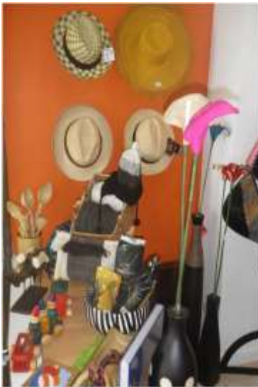
Foto arreglo vitrinas Manizales, Caldas- marzo de 2013 ,Artesanías de Colombia S.A.