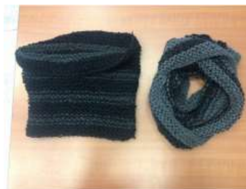
Foto asesoría puntual Tomada por: Alejandra Martínez Manizales, Caldas- marzo 19 de 2013 ,Artesanías de Colombia S.A.