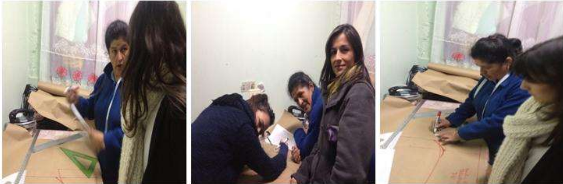
Foto capacitación en patronaje Tomada por: Gloria Duque Marulanda, Caldas- marzo 14-15 de 2013 Artesanías de Colombia S.A.