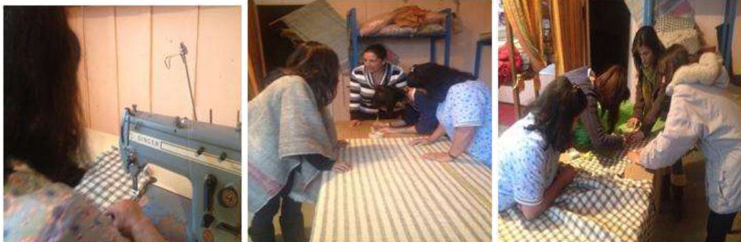
Foto Asistencia técnica Tomada por: Gloria Duque Marulanda, Caldas- marzo 14-15 de 2013