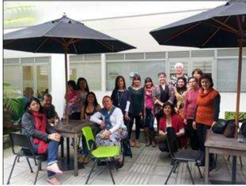
Foto taller TENDENCIAS Tomada por: Gloria Duque Manizales, Caldas- febrero 7 de 2013 ,Artesanías de Colombia S.A.

Se realizó taller en donde se puso en práctica los temas tratados en la charla de tendencias, como fue el manejo de gamas cromáticas, texturas y actitudes, entre otras.