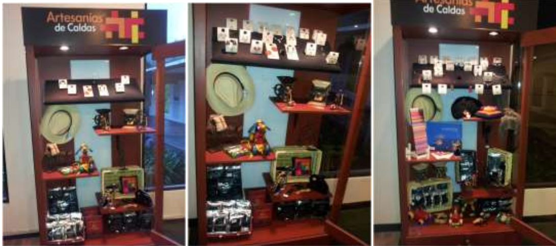
Foto arreglo vitrinas Tomada por: Gloria Duque Manizales, Caldas- marzo de 2013 ,Artesanías de Colombia S.A.