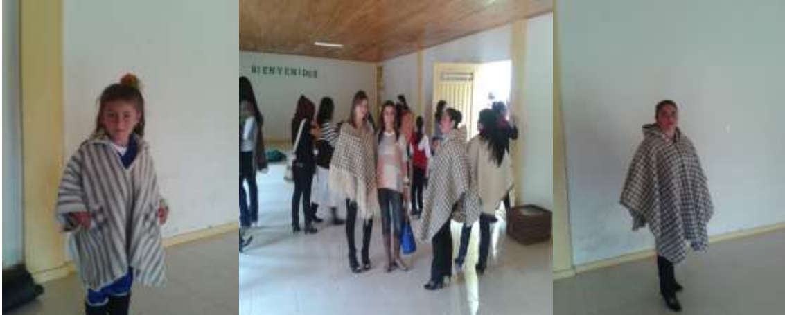
Foto Pasarela Tomada por: Gloria Duque Marulanda, Caldas- marzo 23 de 2013 Artesanías de Colombia S.A.

Los productos diseñados fueron vendidos casi en su totalidad en la exposición artesanal que se hizo posterior a la pasarela, demostrando así su aceptación y la posibilidad de una fácil comercialización.