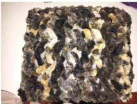
Foto asesoría puntual Tomada por: Gloria Duque Manizales, Caldas- marzo 7 de 2013 ,Artesanías de Colombia S.A.