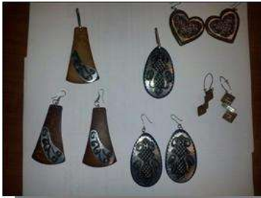
Foto asesoría puntual Tomada por: Gloria Duque Manizales, Caldas- febrero 7 de 2013 ,Artesanías de Colombia S.A.