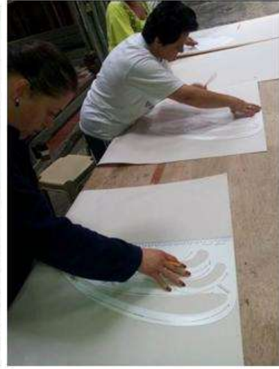
Foto capacitación patronaje y telar horizontal Tomada por: Gloria Duque Salamina, Caldas- febrero 13- 14 de 2013 Artesanías de Colombia S.A.

También se capacitó en tendencias de moda otoño-invierno 2013-2014 y en el conocimiento y manejo de las ruanas, ponchos y bufandas, elaboradas en San Vicente, en las diferentes tipologías de cuerpos existentes.