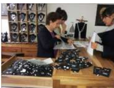
Foto asesoría puntual Manizales, Caldas- febrero 6 de 2013 ,Artesanías de Colombia S.A.