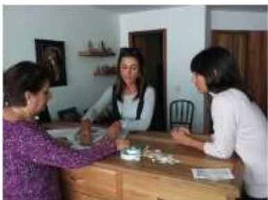
Foto asesoría puntual Tomada por: Liliy Cheun Torres. Manizales, Caldas- febrero 6 de 2013 ,Artesanías de Colombia S.A.

Esta beneficiaria, trabaja principalmente plata y perlas, pero se ha sugerido la implementación del cacho, logrando así una línea más económica, buscando llegar a todo tipo de mercado. Por otro lado se ha hecho asesoría en cuanto a forma y modulación de los diseños.