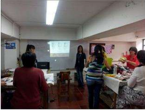
Foto taller TENDENCIAS Tomada por: Gloria Duque Manizales, Caldas- febrero 7 de 2013 ,Artesanías de Colombia S.A.