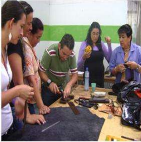
Foto asistencia técnica Tomada por: Gloria Duque Aranzazu, Caldas- febrero 9 de 2013 Artesanías de Colombia S.A.

Piedrahita, dictó una charla en la cual se dejaron claras las bases para el oficio y se despejaron las dudas de los artesanos de Aránzazu.