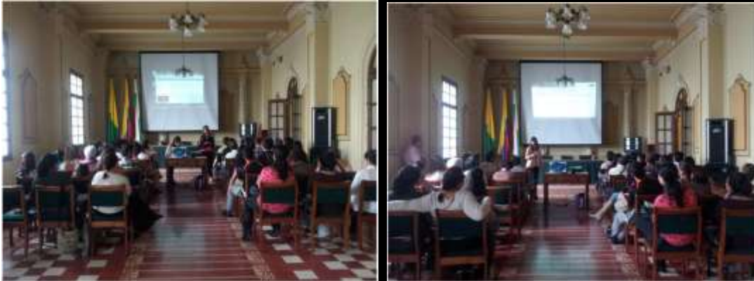
Foto CAPACITACIÓN TENDENCIAS Tomada por: Gloria Duque Manizales, Caldas- FEBRERO DE 2013 ,Artesanías de Colombia S.A.