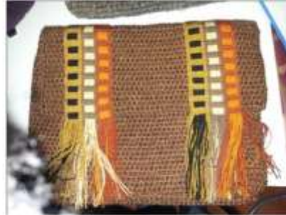
Foto asesoría puntual Tomada por: Gloria Duque Manizales, Caldas- febrero 28 de 2013 ,Artesanías de Colombia S.A.