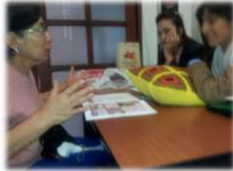
Foto asesoría puntual Tomada por: Gloria Duque Manizales, Caldas- febrero 8 de 2013 ,Artesanías de Colombia S.A.

Con esta artesana se viene desarrollando la línea hogar, compuesta por un pie de cama y dos cojines elaborados en crochet. Se hace un juego con las figuras geométricas y la gradación de colores teniendo en cuenta los establecidos para la temporada.