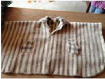
Foto Asistencia técnica Tomada por: Gloria Duque Marulanda, Caldas- marzo 23 de 2013 Artesanías de Colombia S.A.