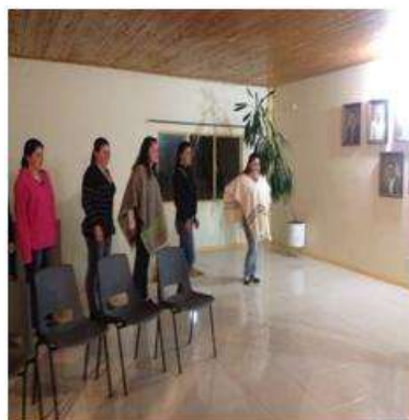
Foto capacitación Tomada por: Gloria Duque Marulanda, Caldas- marzo 14-15 de 2013 Artesanías de Colombia S.A.

Se hizo parte de la logística en la celebración de los 75 Años de la Cooperativa ovina.