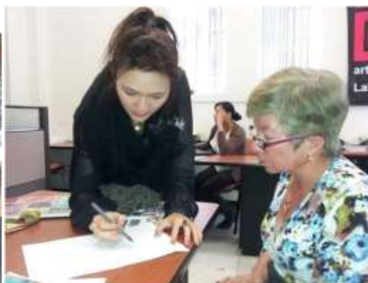
Foto asesoría puntual Tomada por: Alejandra Martínez Manizales, Caldas- febrero 18 de 2013 ,Artesanías de Colombia S.A.