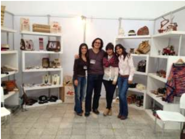
Fotos Stand Expo equinos Manizales, Caldas, Marzo22;24 de 2013 Artesanías de Colombia S.A.