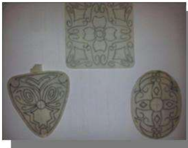
Foto asesoría puntual Manizales, Caldas- febrero 7 de 2013 ,Artesanías de Colombia S.A.