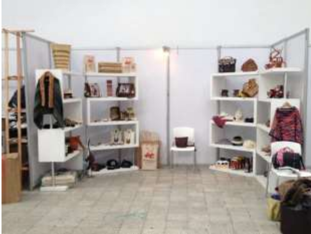
Fotos Stand Expo equinos Tomada por; Gloria Duque Manizales, Caldas, Marzo22;24 de 2013 Artesanías de Colombia S.A.