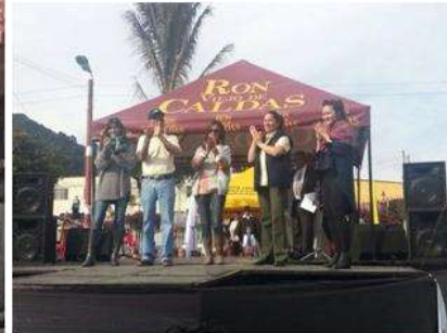
Foto Pasarela Tomada por: Gloria Duque Marulanda, Caldas- marzo 23 de 2013 Artesanías de Colombia S.A.