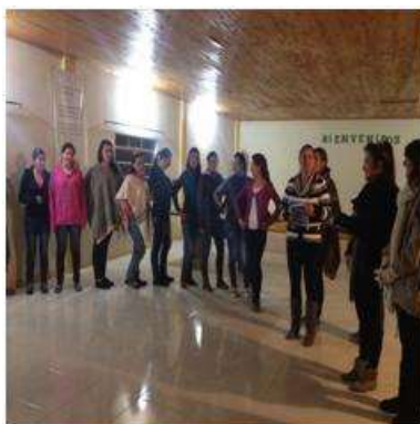
Foto capacitación Tomada por: Gloria Duque Marulanda, Caldas- marzo 14-15 de 2013 Artesanías de Colombia S.A.