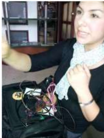
Foto asesoría puntual Manizales, Caldas- febrero 21 de 2013 ,Artesanías de Colombia S.A.