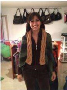
Foto asesoría puntual Tomada por: Gloria Duque Manizales, Caldas- marzo 11 de 2013 ,Artesanías de Colombia S.A.