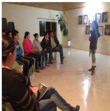
Foto capacitación Tomada por: Gloria Duque Marulanda, Caldas- marzo 14-15 de 2013 Artesanías de Colombia S.A.