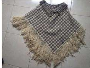
Foto Asistencia técnica Tomada por: Gloria Duque Marulanda, Caldas- marzo 23 de 2013 Artesanías de Colombia S.A.