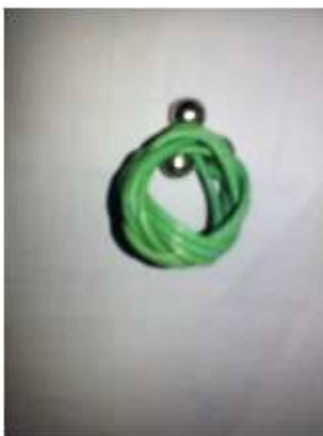
Foto asesoría puntual Tomada por: Alejandra Martínez Manizales, Caldas- febrero 21 de 2013 ,Artesanías de Colombia S.A.