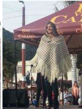
Foto Pasarela Tomada por: Gloria Duque Marulanda, Caldas- marzo 23 de 2013 Artesanías de Colombia S.A.