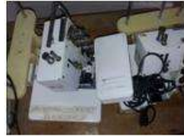
Foto asistencia técnica Tomada por: Gloria Duque Aranzazu, Caldas- febrero 9 de 2013 ,Artesanías de Colombia S.A.

Diagnóstico del estado de la maquinaria del taller, donde se encontraron: