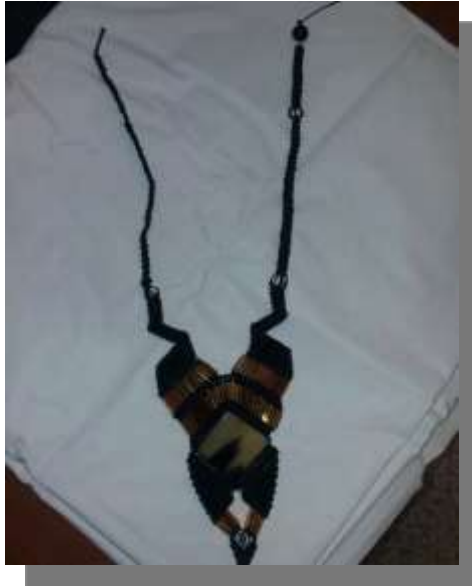
Foto asesoría puntual Tomada por: Gloria Duque Manizales, Caldas- febrero 5 de 2013 ,Artesanías de Colombia S.A.

La técnica macramé, es la que este artesano fusiona con cacho y bisutería. Se le hace la sugerencia de hacer exploración de diferentes calibres de hilo y texturas un poco más suave, a la vez se planteó la modulación de las formas que viene trabajando.