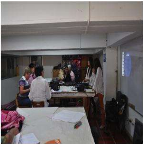
Foto talleres marzo Tomada por: Gloria Duque Manizales, Caldas- marzo 5 de 2013 ,Artesanías de Colombia S.A.