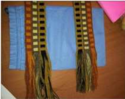
Foto asesoría puntual Tomada por: Gloria Duque Manizales, Caldas- febrero 28 de 2013 ,Artesanías de Colombia S.A.