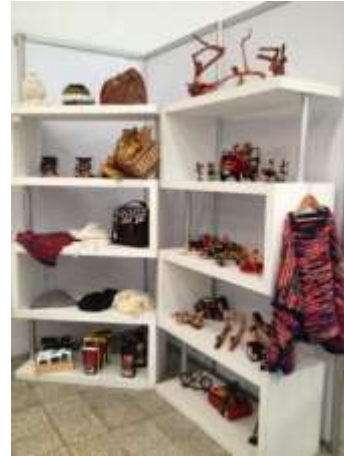
Fotos Stand Expo equinos Manizales, Caldas, Marzo22;24 de 2013 Artesanías de Colombia S.A.