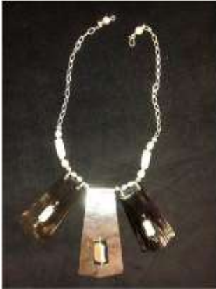
Foto asesoría puntual Manizales, Caldas- febrero 6 de 2013