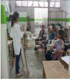
Foto taller tendencias y manejo de telar Tomada por: Gloria Duque Aranzazu, Caldas- febrero 9 de 2013 ,Artesanías de Colombia S.A.