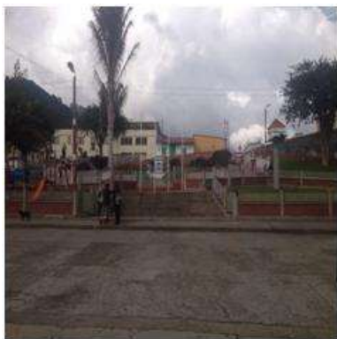
Foto capacitación Tomada por: Gloria Duque Marulanda, Caldas- marzo 14-15 de 2013 Artesanías de Colombia S.A.