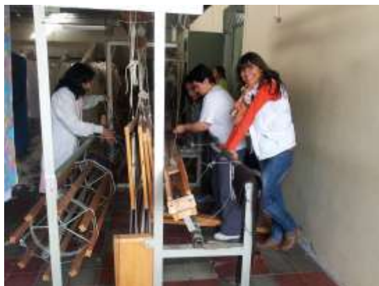
Foto capacitación patronaje y telar horizontal Tomada por: Gloria Duque Salamina, Caldas- febrero 13- 14 de 2013 Artesanías de Colombia S.A.

Realizamos asistencia técnica y capacitaciones en tejido plano y patronaje a san Vicente de paúl, en las cuales se enseñó a diseñar tejidos en planos y a plasmarlos en el telar, por otro lado se capacitó en patronaje y en tallaje de las ruanas para lograr así estandarizarlas por tallas S-M-L.