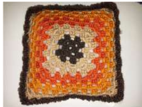
Foto asesoría puntual Tomada por: Gloria Duque Manizales, Caldas- marzo 7 de 2013 ,Artesanías de Colombia S.A.