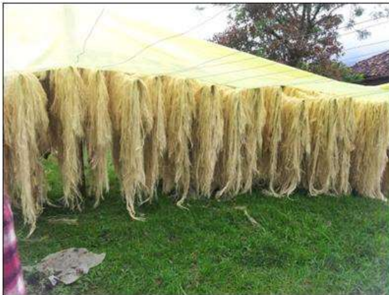
Foto asistencia técnica Tomada por: Gloria Duque Salamina, Caldas- febrero 13- 14 de 2013 ,Artesanías de Colombia S.A.