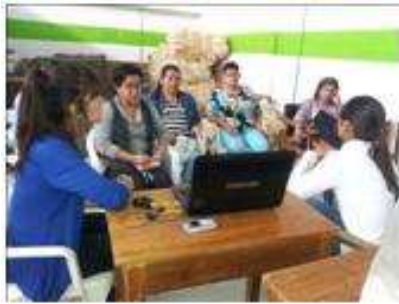
Foto taller tendencias y manejo de telar Tomada por: Gloria Duque Aranzazu, Caldas- febrero 9 de 2013 ,Artesanías de Colombia S.A.