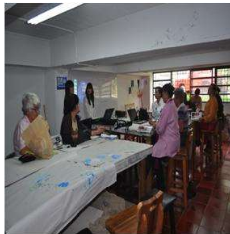
Foto talleres marzo Tomada por: Gloria Duque Manizales, Caldas- marzo 5 de 2013 ,Artesanías de Colombia S.A.