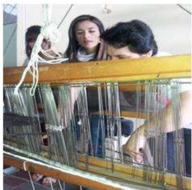
Foto capacitación patronaje y telar horizontal Tomada por: Gloria Duque Salamina, Caldas- febrero 13- 14 de 2013 Artesanías de Colombia S.A.