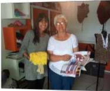
Foto asesoría puntual Tomada por: Gloria Duque Manizales, Caldas- marzo 11 de 2013 ,Artesanías de Colombia S.A.