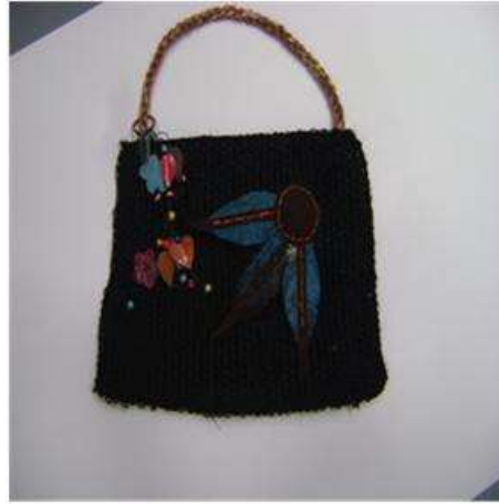
Foto asistencia técnica Tomada por: Gloria Duque Aranzazu, Caldas- febrero 9 de 2013 Artesanías de Colombia S.A.

Capacitación de experto marroquino, en la cual se dictaron los parámetros necesarios, tanto de manera teórica como práctica, para la implementación del tejido de fique y el cuero, para la elaboración de bolsos y complementos marroquinos.