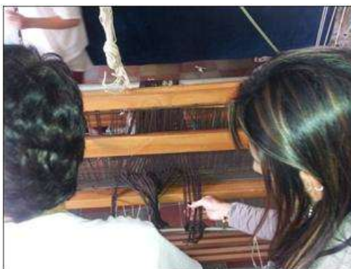
Foto capacitación patronaje y telar horizontal Tomada por: Gloria Duque Salamina, Caldas- febrero 13- 14 de 2013 Artesanías de Colombia S.A.