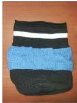
Foto asesoría puntual Tomada por: Alejandra Martínez Manizales, Caldas- febrero 18 de 2013 ,Artesanías de Colombia S.A.