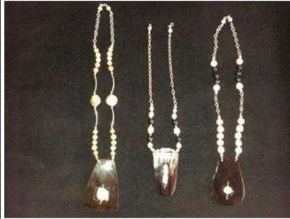
Foto asesoría puntual Tomada por: Gloria Duque Manizales, Caldas- febrero 6 de 2013 ,Artesanías de Colombia S.A.