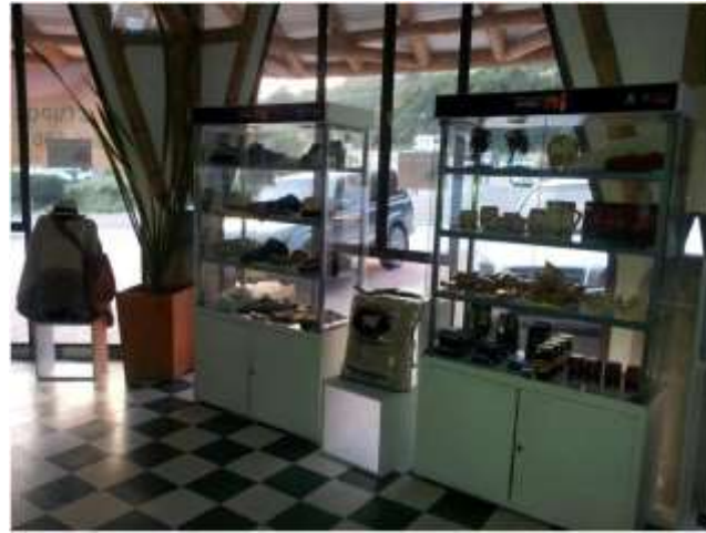
Foto arreglo vitrinas Tomada por: Gloria Duque Manizales, Caldas- marzo de 2013 ,Artesanías de Colombia S.A.