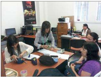
Foto asesoría puntual Tomada por: Alejandra Martínez Manizales, Caldas- febrero 18 de 2013 ,Artesanías de Colombia S.A.