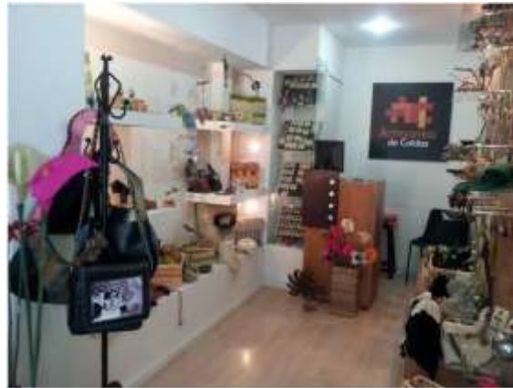
Foto arreglo vitrinas Manizales, Caldas- marzo de 2013 ,Artesanías de Colombia S.A.