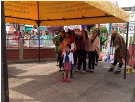
Foto Pasarela Tomada por: Gloria Duque Marulanda, Caldas- marzo 23 de 2013 Artesanías de Colombia S.A.