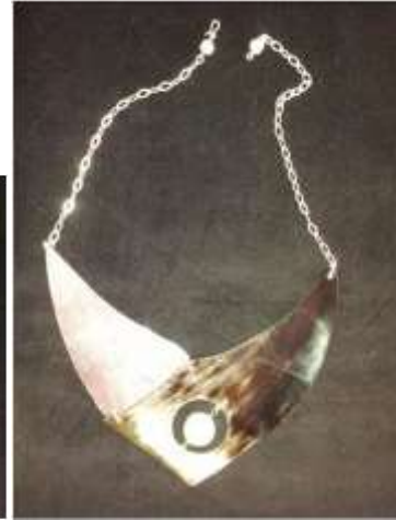
Foto asesoría puntual Manizales, Caldas- febrero 6 de 2013 ,Artesanías de Colombia S.A.