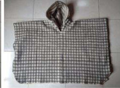
Foto Asistencia técnica Tomada por: Gloria Duque Marulanda, Caldas- marzo 23 de 2013 Artesanías de Colombia S.A.