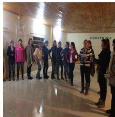
Foto capacitación Tomada por: Gloria Duque Marulanda, Caldas- marzo 14-15 de 2013 Artesanías de Colombia S.A.