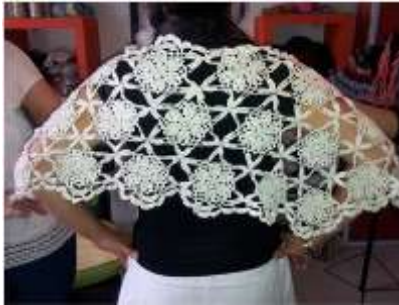
Foto asesoría puntual Tomada por: Gloria Duque Manizales, Caldas- marzo 11 de 2013 ,Artesanías de Colombia S.A.