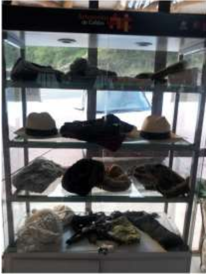
Foto arreglo vitrinas Manizales, Caldas- marzo de 2013 ,Artesanías de Colombia S.A.