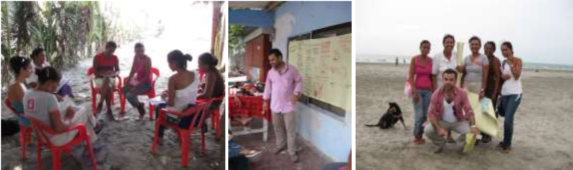
Primeras sesiones de aprestamiento y socialización del proyecto con la comunidad de Boquilla.