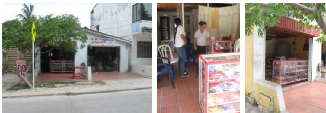
Derecha e izquierda: Comunidad de Olaya Herrera caracterizada por iniciativas productivas informales.

que ha sido hecha con rellenos por sus moradores quienes se ubicaron en ella en calidad de invasores hace mas de 40 años. A pesar de importantes esfuerzos en cuanto a procesos de titulación, la localidad se caracteriza por poseere amplios asentamientos ilegales, en donde la marginalidad se manifiesta por las precarias condiciones de la vivienda, la presencia de población desplazada y la peligrosidad de algunos sectores. En este sector viven cerca de 13000 personas en donde las condiciones de pobreza se han vivido de generación en generación, manteniendo un círculo crónico que no se ha podido romper. En dicho sector trabaja la Fundación Granitos de Paz ( www.granitosdepaz.org.co ), aliada de Fundación Clinton. El trabajo de dicha alianza se ha centrado en la inclusión productiva de la comunidad de este sector, y en el mejoramiento de condiciones de vida mediante mejoramiento de vivienda. Una de sus líneas de acción son las artesanías y los trabajos manuales. Estos beneficiarios tienen un nivel técnico disímil en los oficios de trabajos en cacho, coco, macramé en fique e hilo encerado, y crochet.