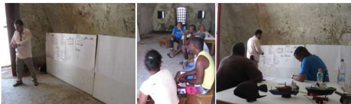
Primeras sesiones de aprestamiento y socialización del proyecto con la comunidad de Bocachica.

3.1.a Comisión I: desplazamiento para la realización del diagnóstico basado en la demanda, en donde se tocaron temas inherentes a aprestamiento y socialización del proyecto con las comunidades, y visitas de reconocimiento a los hoteles. Con la información recolectada se estructuró la metodología y la estrategia de intervención con cada comunidad que constituyeron el entregable No. 1. Tuvo una duración de 15 días a partir del 30 de Marzo. (Para ver información específica, remitirse al anexo No. 1).