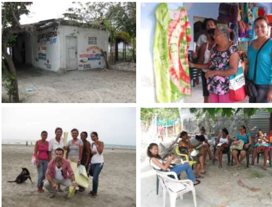
La boquilla posee 16.500 habitantes en condiciones de vulnerabilidad y la artesanía es una de las vocaciones productivas del corregimiento. La asociación Norismar está compuesta por 11 asociadas con variadas técnicas. Arriba: Sede con punto de venta para comercialización de artesanías en la playa de la Boquilla de la Asociación Norismar. Abajo: Fase de aprestamiento del proyecto.

crochet, y la talla en materiales como el coco, totumo, hueso; y se halla compuesta por once beneficiarias(os). Esta colectividad ha estructurado un modelo asociativo que intenta encausar una capacidad productiva adquirida en otros proyectos a través de la manufactura y venta de accesorios de mesa y cocina y de moda. El comercio es informal face to face a través del sector turismo en la costa de Cartagena y a través de un punto de venta directo y propio en las playas de La Boquilla.