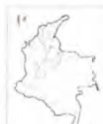
Mapa Islas San Andrés y Providencia Artesanías de Colombia