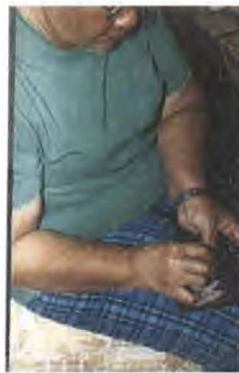
Proceso de elaboración de las piezas