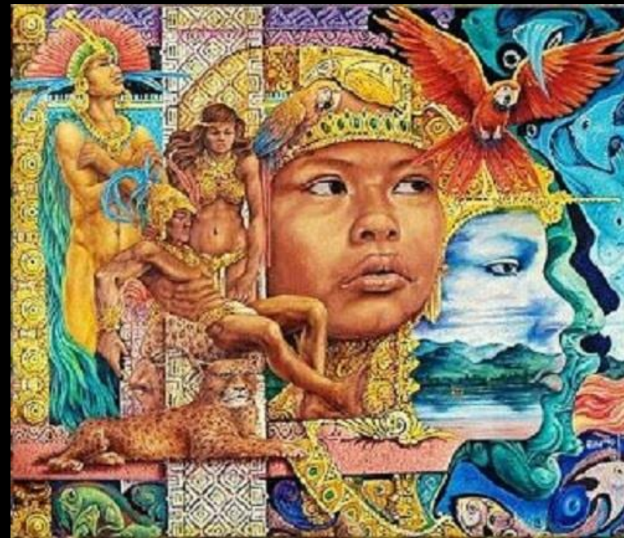
Alfredo Viivero Resurrección del Mito Pintor Colombiano

Lo que lleva a la fecundación prohijada por los dioses intermediarios y atmosféricos: el trueno, el relámpago y el rayo. Sus ritos, mitos y símbolos son, pues, emulaciones de esta danza que bailan los dioses, cuya expresión en el plano de la tierra es el despliegue espacial de lo manifestado. Las perpetuas demostraciones de la fertilidad y generación de la naturaleza son un constante asombro que reverencia en ellas la presencia de la sacralidad en cuya familiaridad vive de uno u otro modo sumergido.”