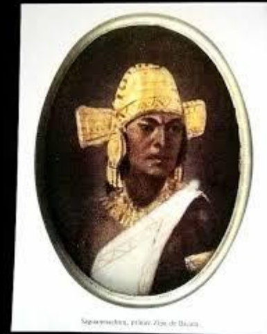
Lucas Fernandez de Piedrahita Nuevo Reyno de Granada 1624 -1688