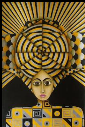
NEMKETAQOA O FO