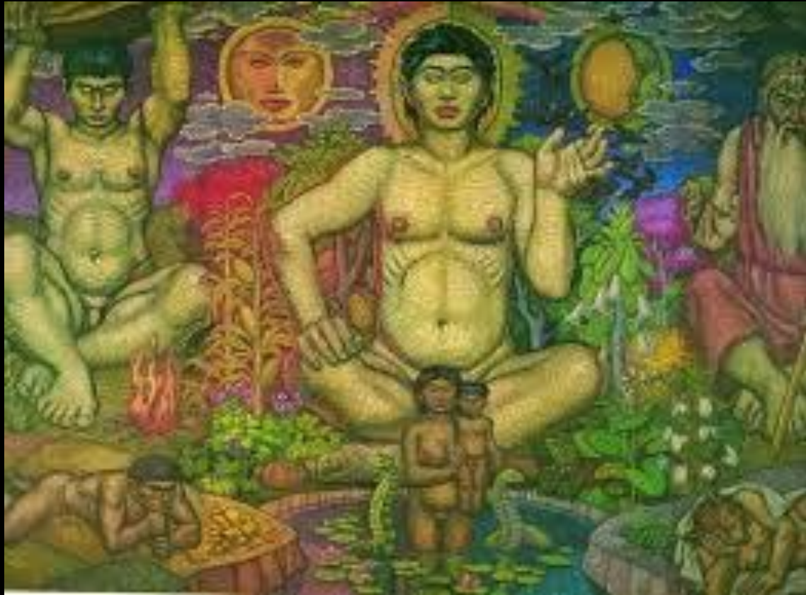
Cuadro Cosmovisión Muisca. Alberto Acuña

En la cultura muisca, hay un tiempo y una historia en la que se mueven y actúan unos seres sagrados. Por tanto, en ellos también hay percepción de un tiempo y de una historia sagrada. La consecuencia de esto es concretamente la percepción mítica de una naturaleza sagrada.