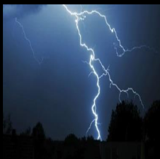
P KUA HAZHA