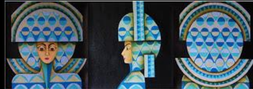
AGUA S IE