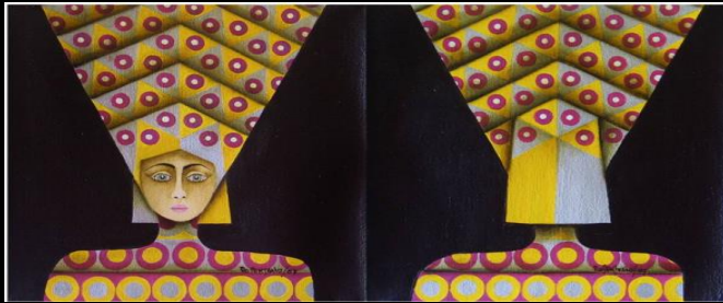
TIERRA HY S TCHA