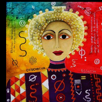
TCHIB TCHA KOM