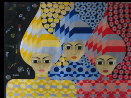
AIRE F IBA