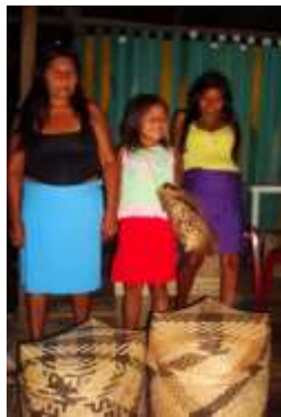
Lugar: Bocas de Víbora, Nariño Fecha : 16/10/2011 Descripción: Mujeres artesanas y niña de la etnia Eperaara Siapidaara, junto a canastos elaboradas con la fibra de chocolatillo.