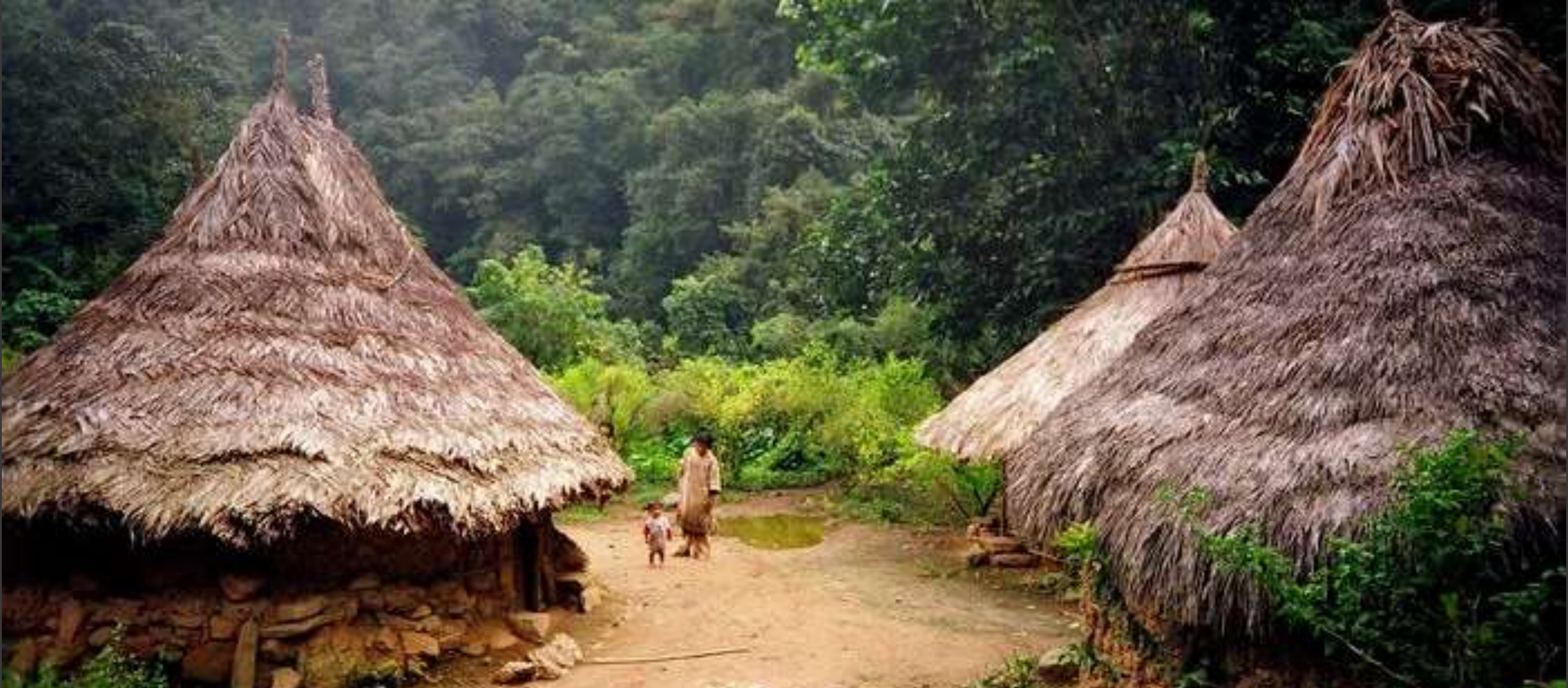
Kogui "Los guardianes de la armonía del mundo" - Kaggabba, Kogui, Cogui.