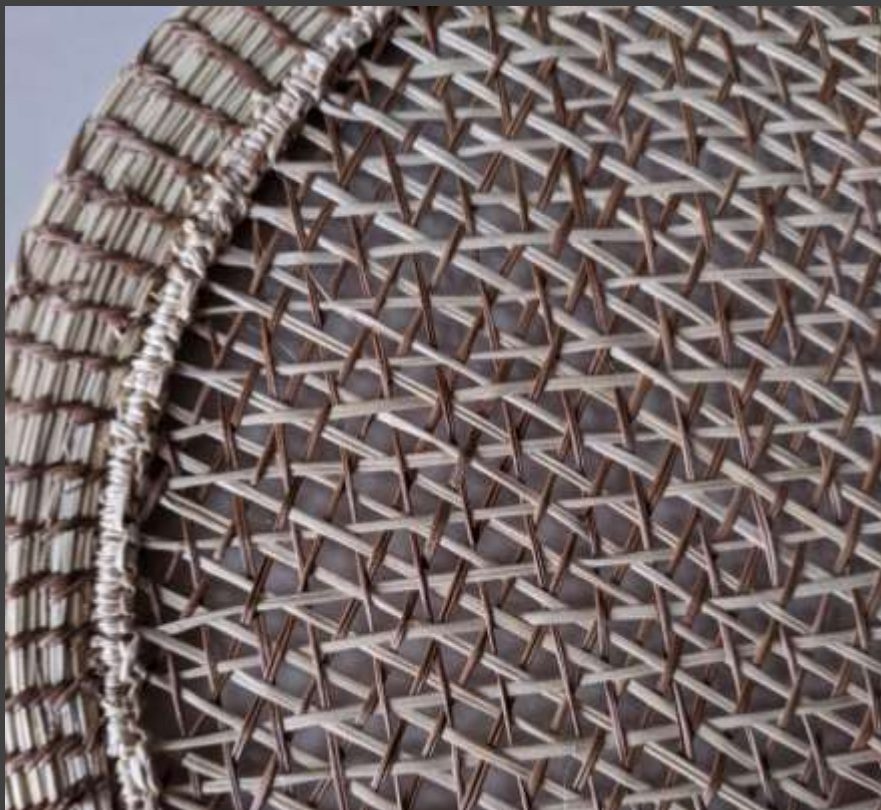
Adelanto muestras diversificación de producto Aguadas