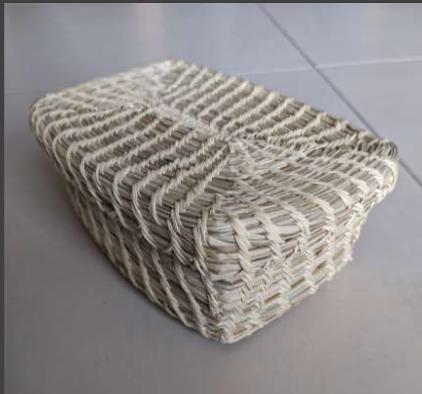
Muestra diversificación de productos Aguadas