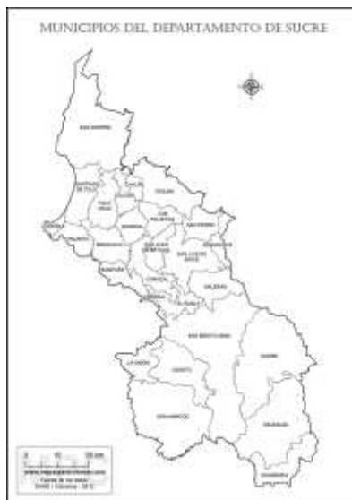
Ubicación geográfica Sucre

Es importante tener en cuenta que la para este primer piloto solo se atenderán los municipios de Morrea, Sincelejo y Sampués, debido a que son aquellos que cuenta con corredor turístico y deben ser intervenidos para mejorar su ventas y aumentar sus ingresos como artesanos.