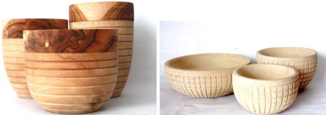
Descripción: Productos artesanales de Sampués Tomada por: Laboratorio de Sucre – Artesanías de Colombia S.A. Lugar: Sampués. Sucre, Colombia.

En cuanto a productos se encuentran: hamacas, contenedores, sombreros, mobiliario, objetos decorativos, joyería en diferentes materias primas.