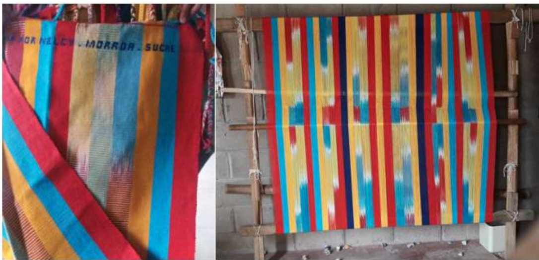
Descripción: Productos artesanales de Morroa