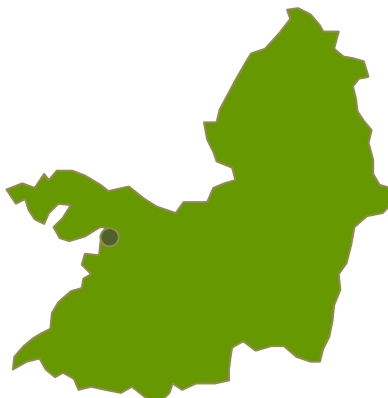
Mapa de la ubicación geográfica del municipio de Buenaventura

El Pacífico se caracteriza por ser uno de los territorios con mayor presencia de grupos étnicos en el país. El 90% de su población es afrodescendiente y el 6% lo integran los pueblos indígenas embera dóbida, embera chamí, embera katío, eperara siapidara, wounaan, awa y tule. Mientras que apenas el 4% lo integra la población mestiza. Las características de su poblamiento, las reivindicaciones étnicas territoriales alcanzadas a partir de la Constitución de 1991 y la alta biodiversidad que se reconoce en los bosques húmedos tropicales que la conforman, han conducido a que un porcentaje cercano al 70% de la región se encuentre jurídicamente excluido del mercado de tierras, por constituir territorios colectivos de comunidades negras, resguardos indígenas o parques naturales.