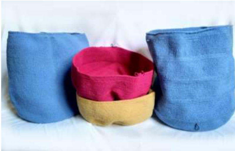
Mochilas de un sólo color

Calidad de los tejidos: La calidad de los tejidos cada día va desmejorando, debido a la competencia en el departamento por la gran demanda de mochilas, el precio del producto cada día es más bajo, por esto la comunidad deja de exigirse para lograr calidad y distinción, adicionalmente, debido a los precios bajos, eligen eliminar el manejo de iconografía tradicional como los Kannas o las flores, ya que una mayor complejidad del diseño implica mayores tiempos de tejido.