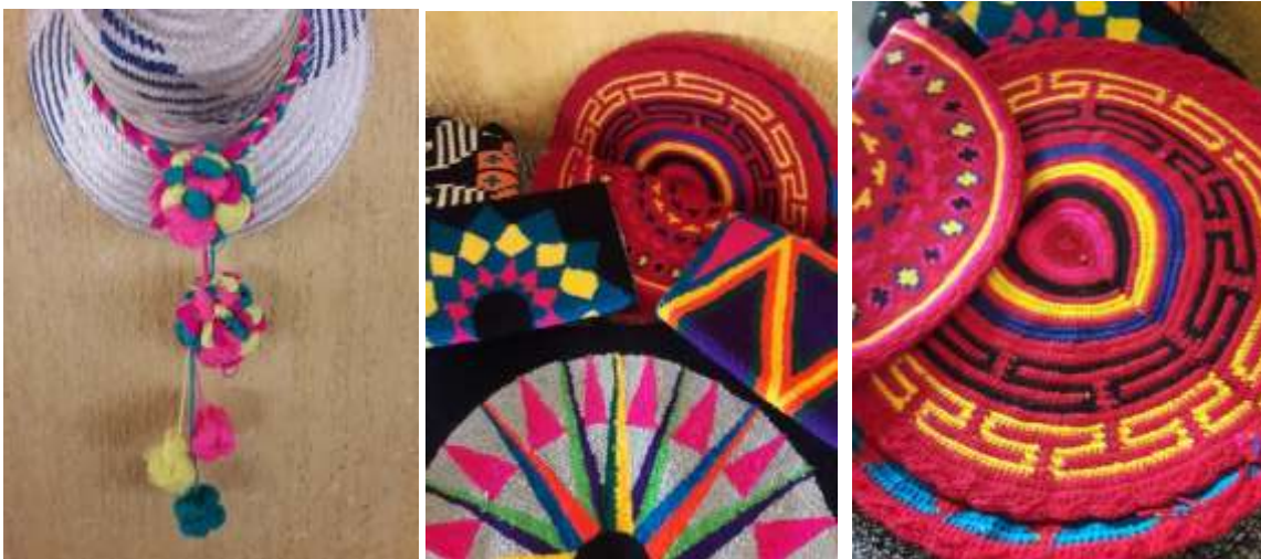
Artesanías de la comunidad Utauthu.

El oficio de tejer en la comunidad Utaithu es una actividad que se hereda de sus ancestros, el tejido y la calidad de ellos demuestra el compromiso de crecer como etnia, las artesanías wayuu caracterizadas por sus colores, diseños y complejidad de técnicas las cuales simbolizan elementos representativos en la naturaleza como animales, plantas, rostros, etc... los cuales obligan al artesano a realizar mochilas de alta complejidad en donde la pieza adquiere más valor.