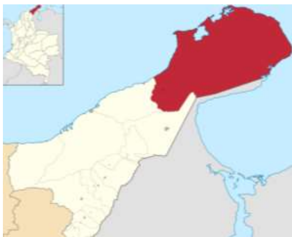
Ilustración 2. Mapa división política de la Guajira. Municipio de Uribia.

El municipio pertenece a la más septentrional de las penínsulas suramericanas (Península de La Guajira), está situada en el extremo nororiental de la República de Colombia y de América Austral, siendo el más grande en extensión de su departamento ya que ocupa la tercera parte de este.