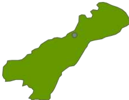
Ilustración 1. Mapa del Dpto. de la Guajira.