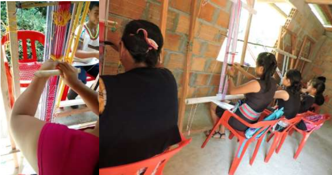
Transmisión de saberes Chumbe Inga 2018

El chumbe es uno de los tejidos tradicionales Inga que se ha iniciado a recuperar, que, además de prenda de vestir, es el elemento que protege el vientre de la mujer. El vientre de la mujer representa al mundo con sus cuatro puntos cardinales. Según lo describe el investigador Benjamín Jacanamijoy. Debido a su importancia cultural es necesario reforzar su aprendizaje.