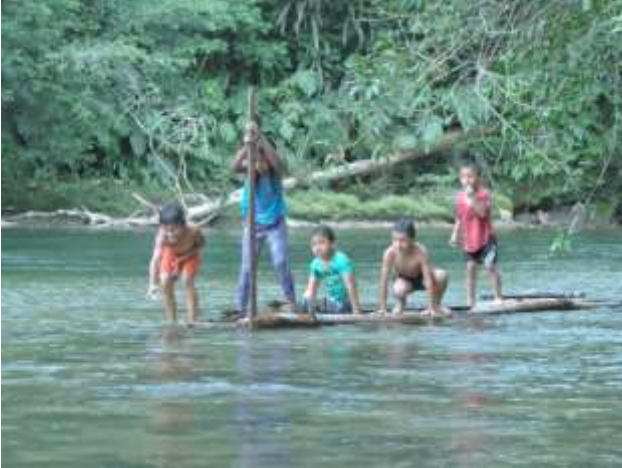
Río Fragüita. 2018.

El territorio de Yurayaco es rico en agua, gracias a los múltiples ríos donde la comunidad pesca. También se cuenta con áreas bastante fértiles y aptas para una gran variedad de cultivos. También por colindar con un área de protección ambiental posee una gran biodiversidad. No obstante, la comunidad se ha visto enfrentada a situaciones difíciles por los cambios acelerados en su territorio, salud, educación, gobernabilidad, género y economía, con la llegada de los colonos que modernizaron el pueblo.