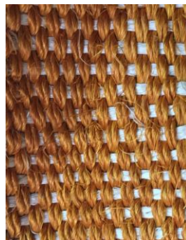
Imagen de ejemplo de exploración de fique con tejido a hebra escondida. Graciela García. Septiembre 2019 archivo fotográfico Artesanías de Colombia

Como estrategia para que las artesanas aumenten el valor de la identidad individual en sus productos se busca promover la exploraciones en materia prima y técnicas. Igualmente se socializan diferentes metodologías de diseño para que las artesanas tengan en sí las herramientas para producir con valores de identidad propios, sepan conceptualizar e identifiquen referentes relevantes.