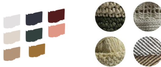
Colores y materiales para identidad colectiva

Igualmente se realiza una matriz de diseño para este año con el fin de unificar los productos y sobretodo de transmitir a las beneficiarias inscritas la importancia de trabajar en grupo por una identidad colectiva. Todo los ejercicios de diseño se plantean desde el concepto de Evolución Local según el cual se busca llegar a productos de look contemporáneo teniendo en cuenta las raíces y orígenes del grupo.