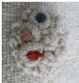
Imagen de ejemplo de exploración de lana bordada con algodón mercerizado. Graciela García. Septiembre 2019 archivo fotográfico Artesanías de Colombia