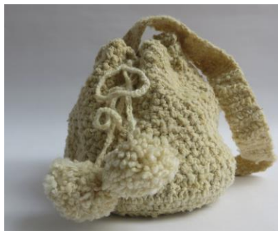
Imagen de ejemplo de exploración de lana 100% en crochet Graciela García. Septiembre 2019