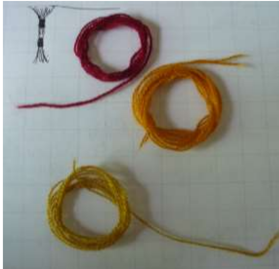
Productos de Cyndi L.Carrascal. Sesquilé Cundinamarca 2018