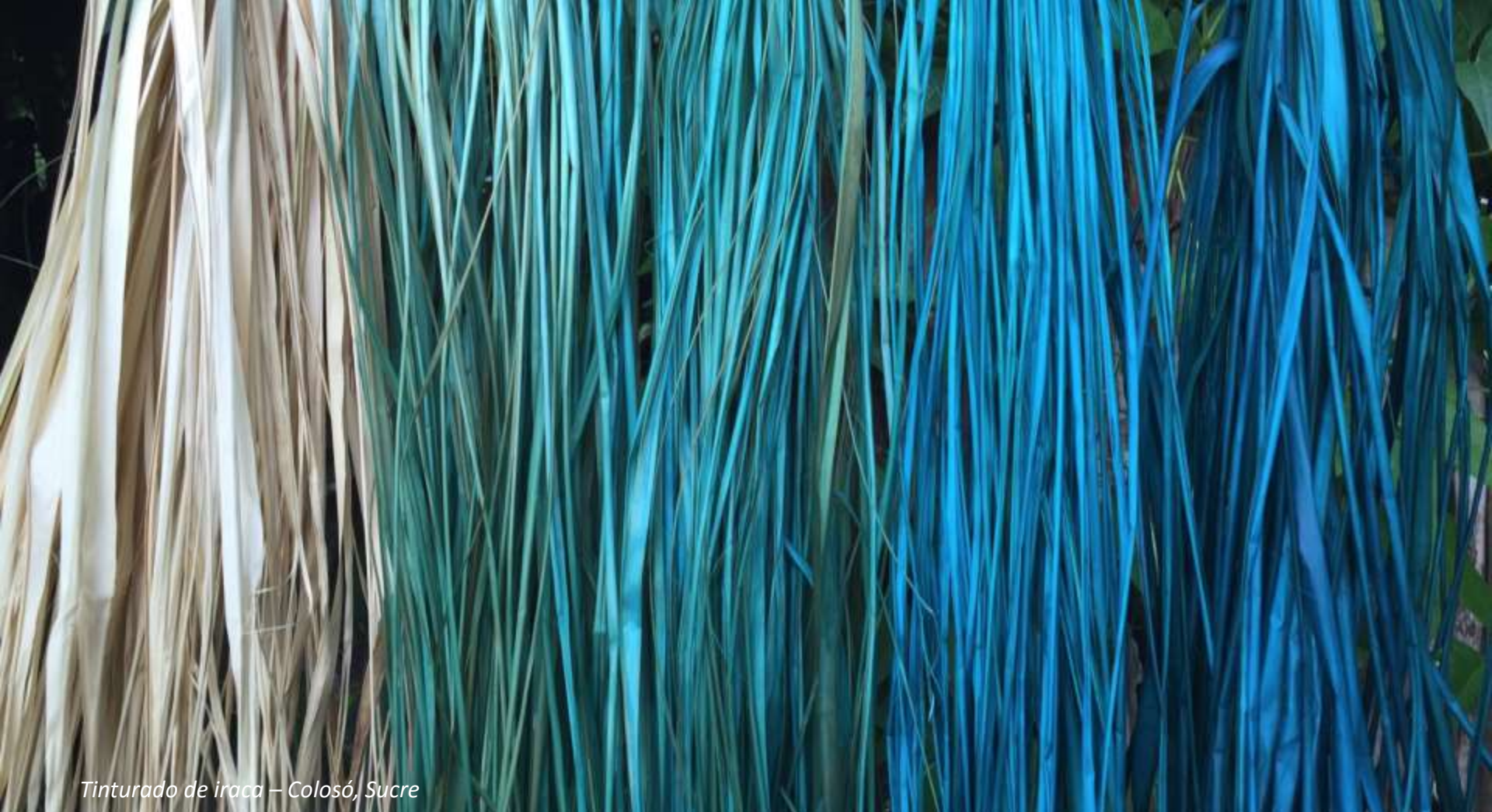
Tinturado de iraca – Colosó, Sucre