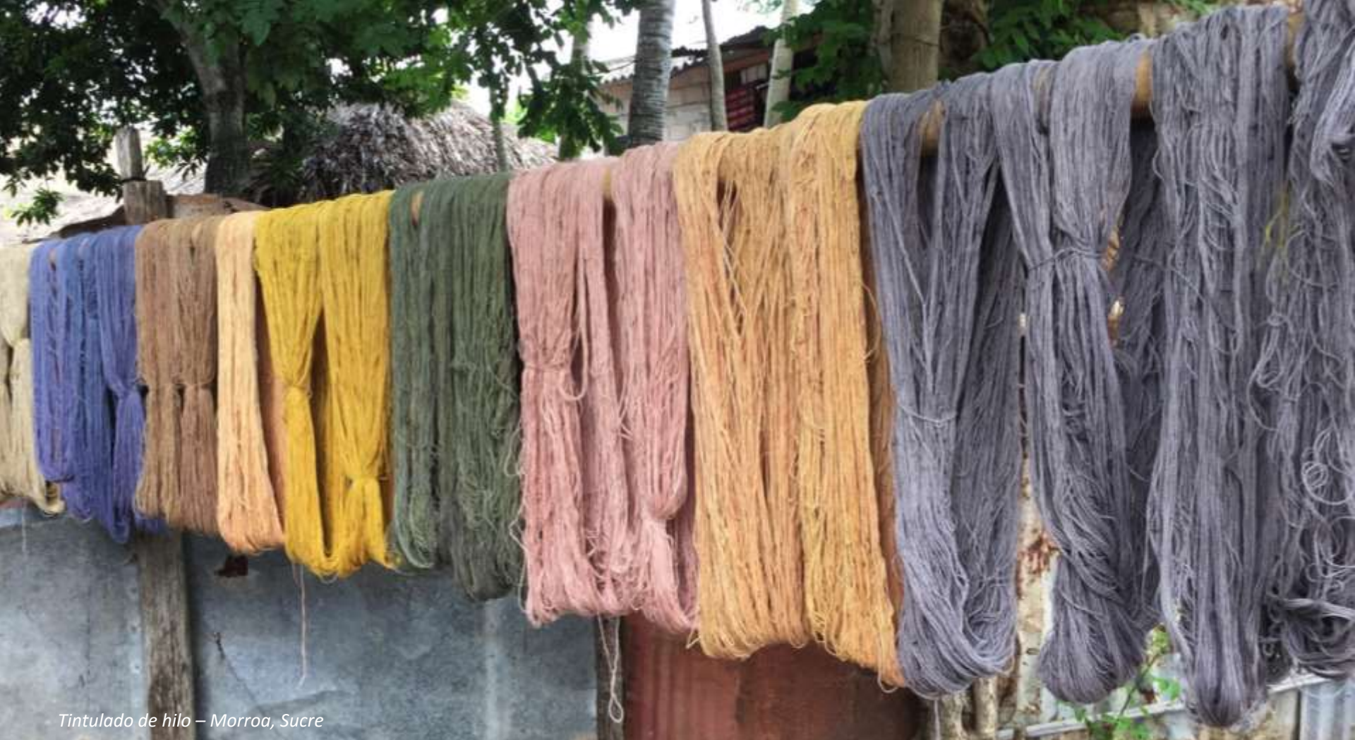
Tintulado de hilo – Morroa, Sucre