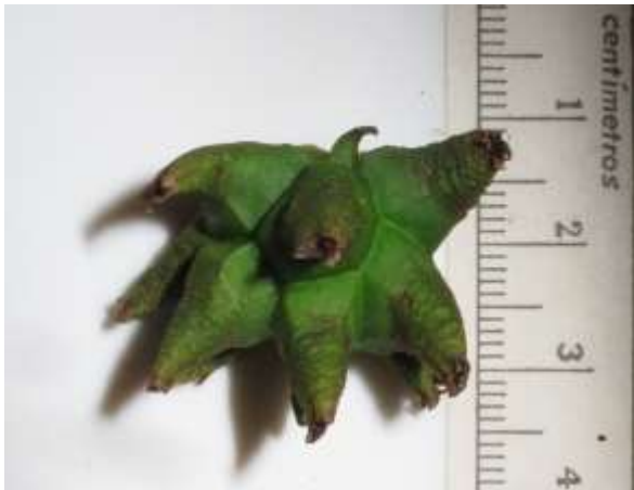
Imagen 1. Infrutescencia en maduración Poulsenia armata

Importante: En varias de las publicaciones consultadas, se tiende a confundir la inflorescencia pistilada (hembra que produce los frutos y semillas) con la estaminada dando una descripción errada tanto de las flores como de la inflorescencia. En las imágenes 1, 2 y 3 se puede ver en detalle la morfología tanto de la inflorescencia, que es un agregado de drupas, como de la semilla.