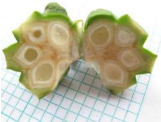
Imagen 2. Corte longitudinal infrutescencia