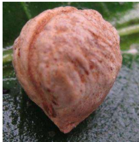
Imagen 3. Semilla