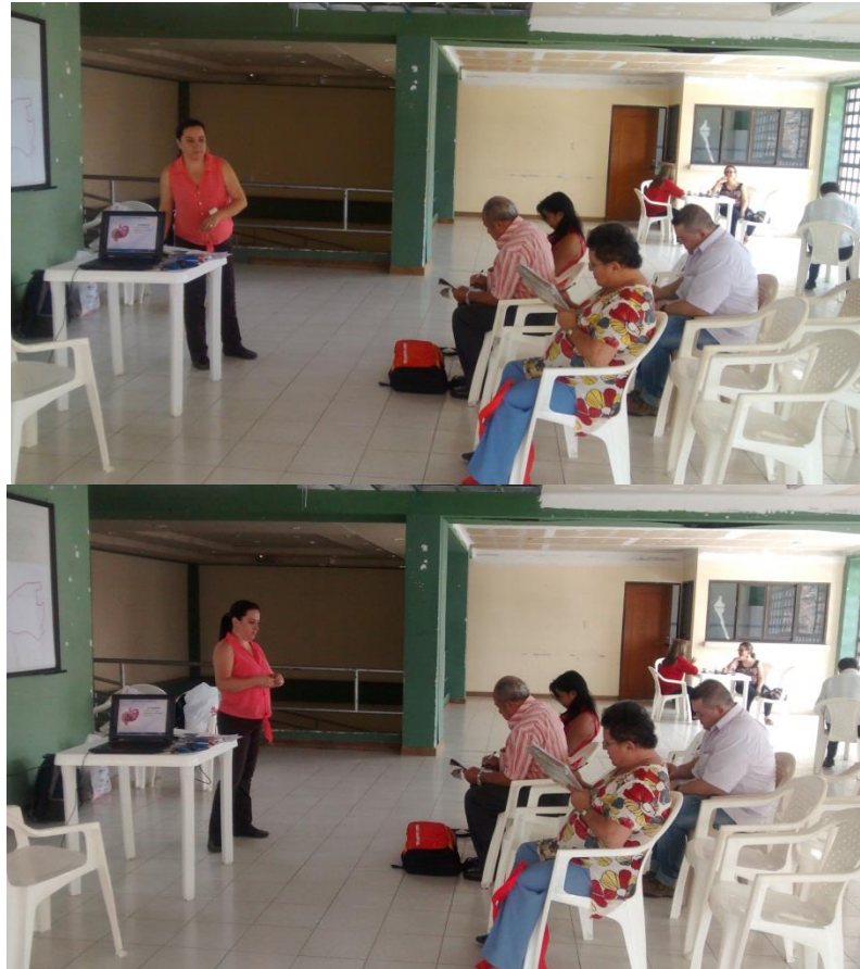
Taller · Mi proyección- la tebaida Quindío, Septiembre 2014

Así, se encontró que los artesanos no es un gremio que establezca un grupo etario uniforme o segmentado en el municipio, se detecta un rango de edad entre los 25 años y los 795 años de edad, nacidos en su mayoría en el municipio de La tebaida, con participación equitativa del género masculino y femenino. En referencia a cada elemento del proyecto de vida se encontró que: