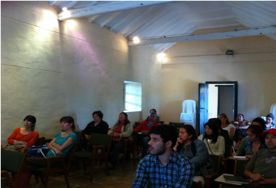
Lugar: Municipio de Villa de Leyva.