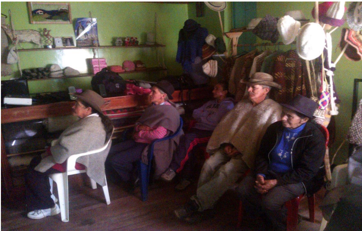
Lugar: Guican

Se dictó taller de asociatividad, con los siguientes temas, Identidad colectiva, el poder de la Asociación, Manejo de conflictos, motivación y expectativas, creación y fortalecimiento de Asociaciones