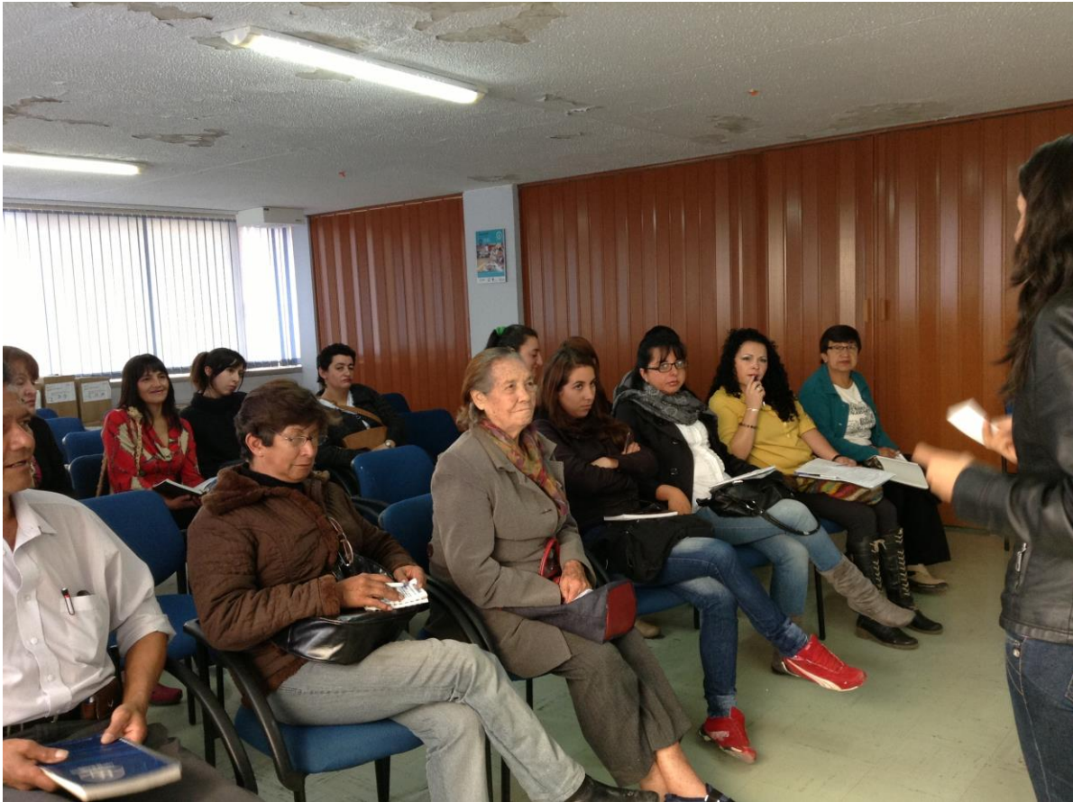
Lugar: Alcaldía de Duitama