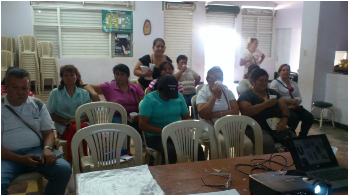
Lugar: Tenza