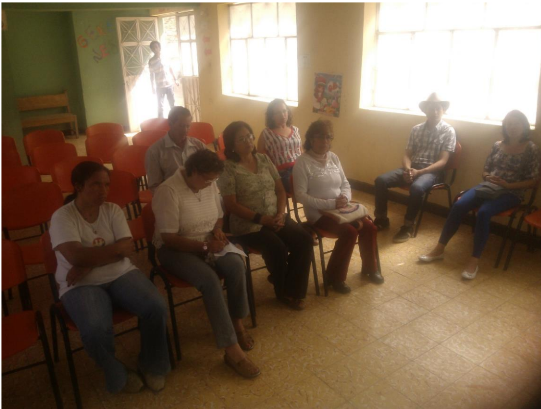
Lugar: Espino

Se dictó taller de asociatividad, con los siguientes temas, Identidad colectiva, el poder de la Asociación, Manejo de conflictos, motivación y expectativas, creación y fortalecimiento de Asociaciones