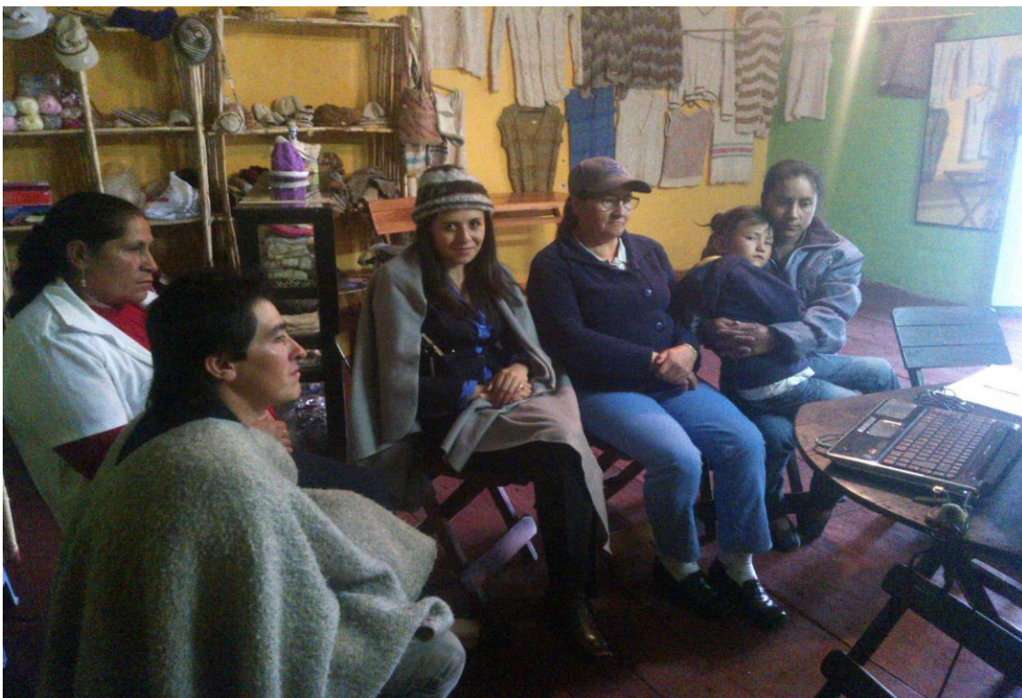
Lugar: Cocuy

Se evidencia falta de unión entre las asociadas.