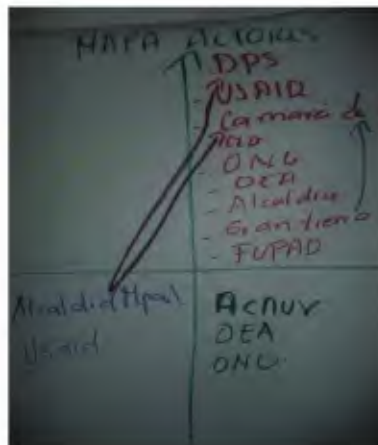
Foto 1. Mapeo de actores

Fuente: Elaboración propia con base en información artesanal, Municipio de Puerto Leguizamo, octubre de 2014.