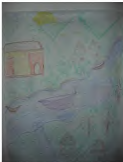
Foto 3. Cartografía social

Fuente: artesanos (Municipio de Leguízamo). Taller de cartografía social, Septiembre de 2014.