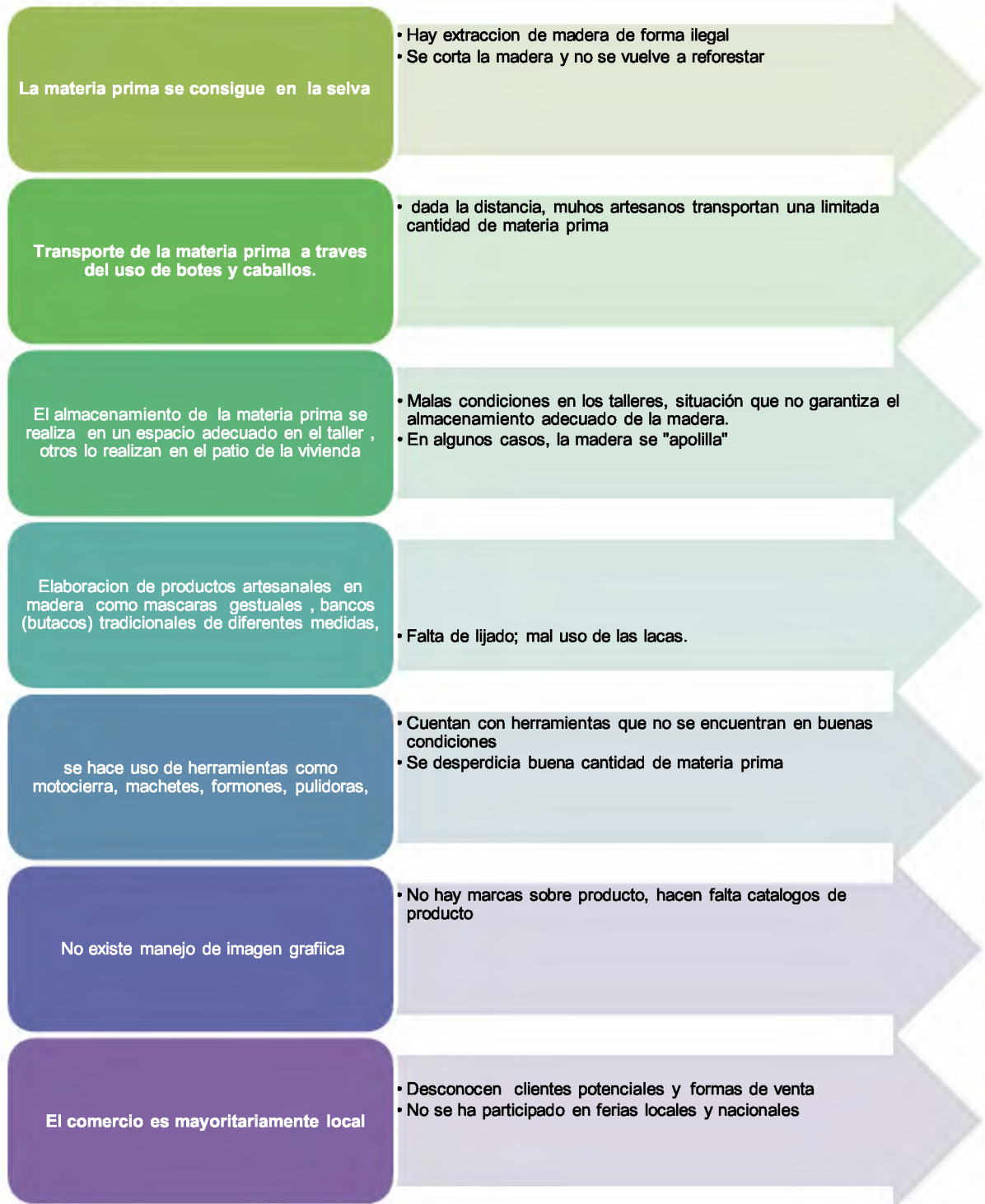
Tabla 1. Mapa artesanal del tallado en madera