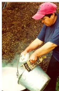
Sulfato Alumbre Sulfato de Hierro Sulfato de Cobre

Son sustancias químicas naturales o sintéticas. Antiguamente se utilizaban las cenizas o algunas sales en su estado natural, hoy se utilizan sales metálicas y ácidas procesadas industrialmente como el aluminio, el cobre, el hierro. Estos mordientes son agentes de los tintes porque hirviendo el baño, el metal se separa de la sal, se pega a la fibra y se une con el tinte.