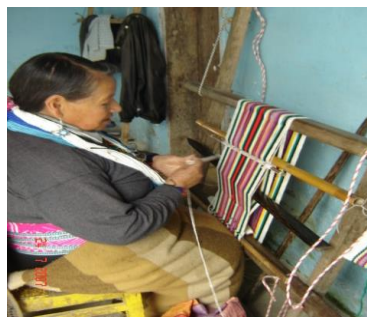
Tallado en madera –Manuales