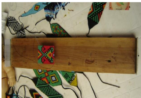
Instrumentos musicales - Manuales