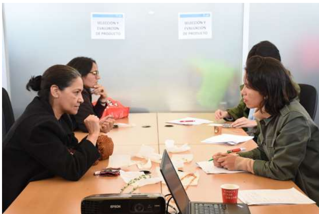
Evaluación de artesanos, 5 de Septiembre de 2017. Lugar: Plaza de Los Artesanos.