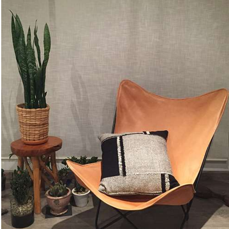
Prototipos Pre-aprobados , Sara González - Oct 2017