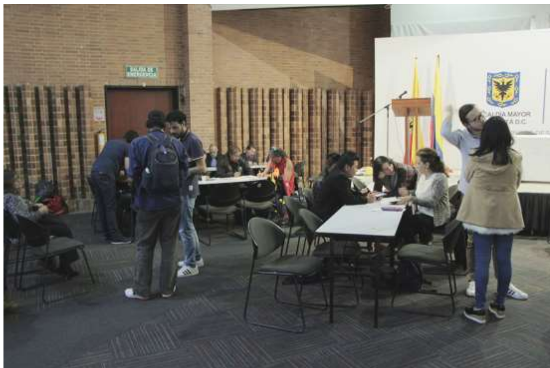
Jornada #3 evaluación de artesanos, 14 de Septiembre de 2017. Lugar: Auditorio, Plaza de Los Artesanos.