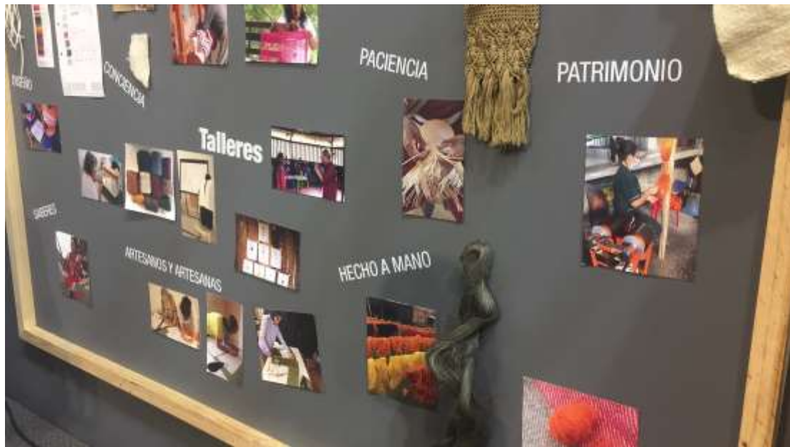
Moodboard Stand Moda Viva, Expoartesánías 2017, Sara González - Dic 2017