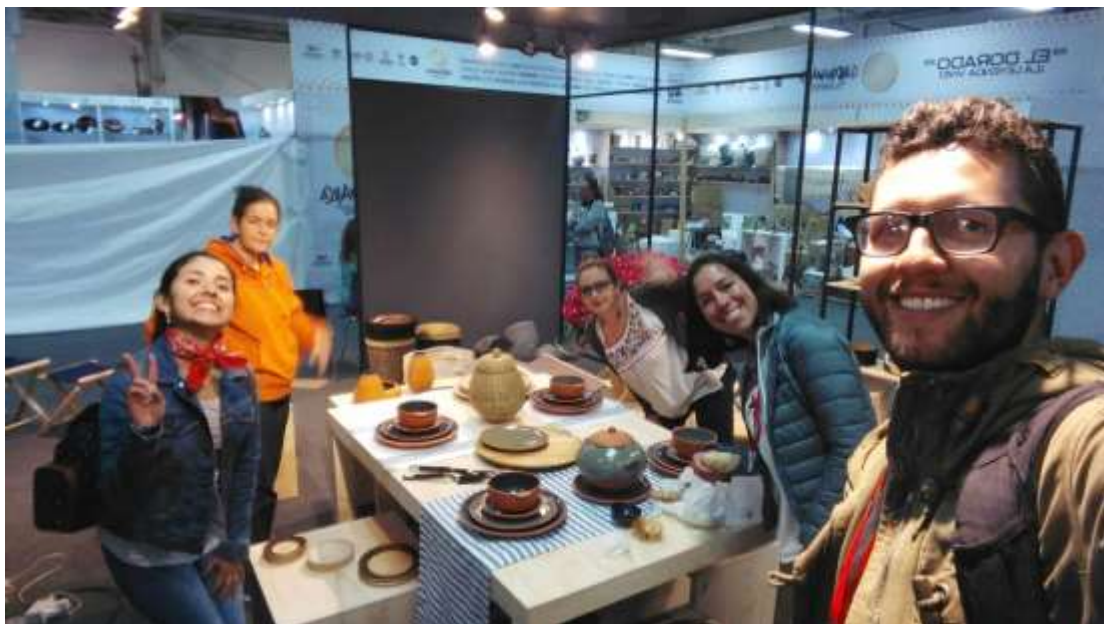
Montaje Feria, L Manuel Alejandro Posada - Dic 2017