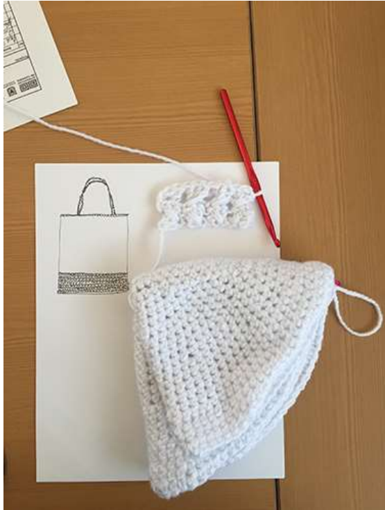
Desarrollo de bocetos , Sara González - Oct 2017