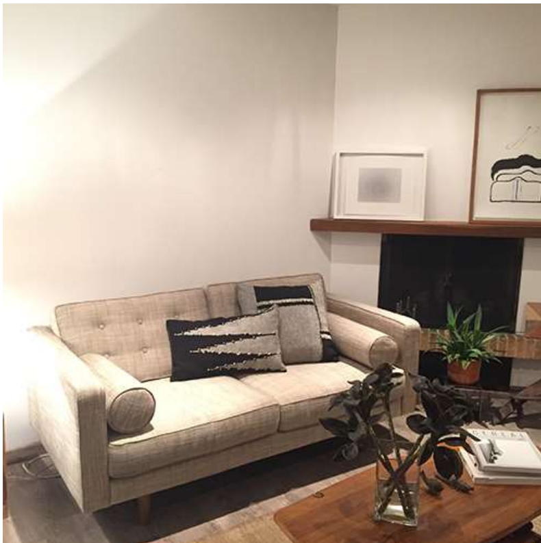
Prototipos Pre-aprobados , Sara González - Oct 2017