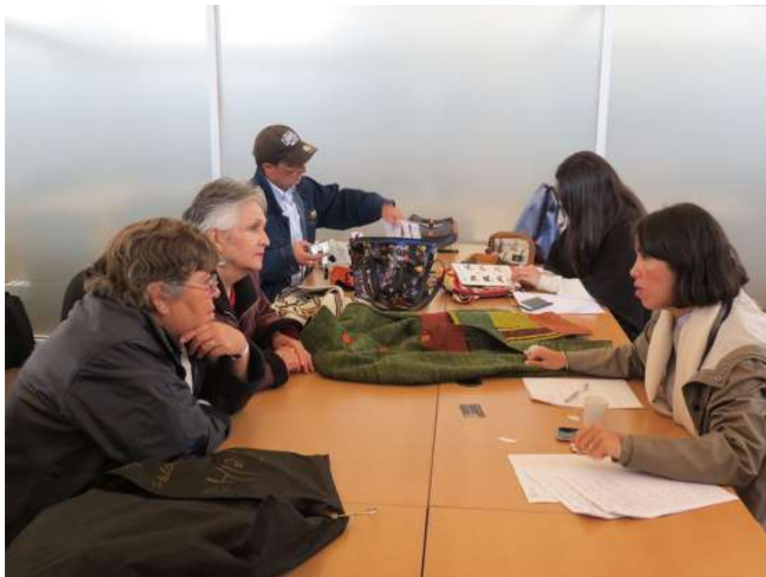
Evaluación de artesanos, Jornada #2, 8 de Septiembre de 2017. Foto de Juan Mario Ortiz (Bogotá, 2017). Lugar: Plaza de Los Artesanos.