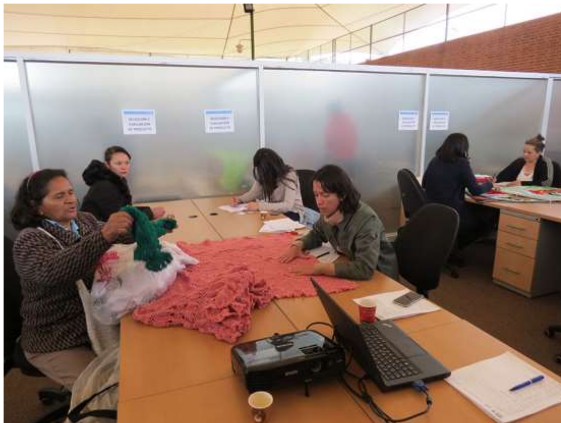
Evaluación de producto de artesanos, 5 de Septiembre de 2017. Foto de Juan Mario Ortiz (Bogotá, 2017). Lugar: Plaza de Los Artesanos.