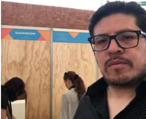
Octubre 21 apoyo en Feria Bogotá Artesanal, (showroom).