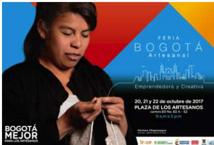
Línea gráfica aprobada, de esta pieza se adaptan y derivan las demás.