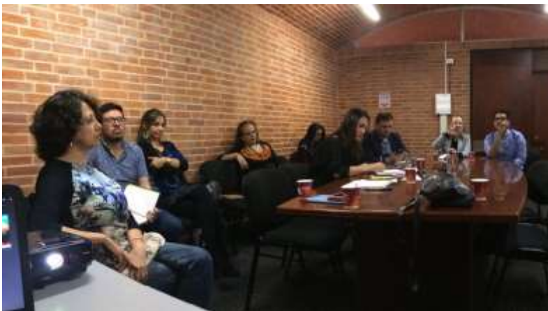
Comité de comunicación 28 de septiembre (Alcaldía, IDT y Artesanías de Colombia)

Para el desarrollo de la feria BOGOTA ARTESANAL, se desarrolla un key visual que se presenta a comité el día 28 de septiembre con ideas de nombres y líneas graficas desarrolladas con el equipo de comunicación del proyecto durante esa semana, para el comité se presentan 2 opciones dando aprobado un nombre y una línea grafica, partiendo de este punto se empiezan a desarrollar las piezas que se requieren para la feria (volantes, bolsas, material de gran formato, escarapelas) (anexo 6) después de 2 semanas de trabajo las piezas son aprobadas el día 13 de octubre, y se envía a producir el sábado 14 de octubre.