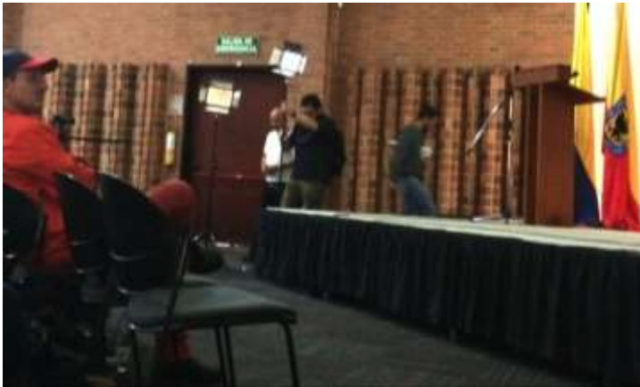
Octubre 4, Curaduría feria octubre, apoyo fotográfico.