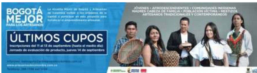
Banner de convocatoria(prorroga adaptación) aprobado y entregado.