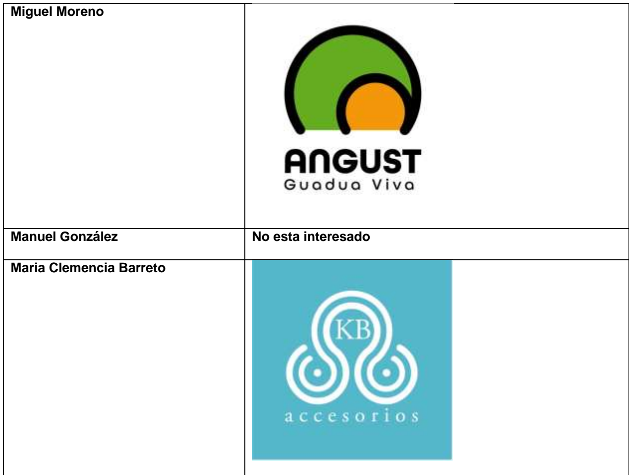
Tabla 2 logos aprobados y entregados