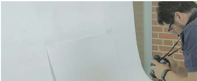
Toma de fotografías de producto, Jornada 2 de evaluación de producto