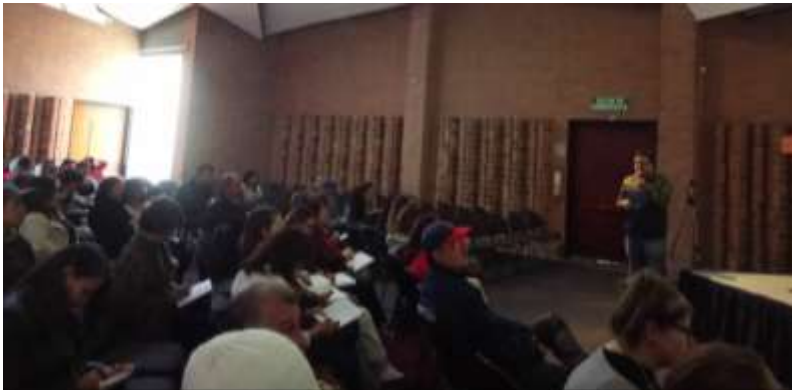
Taller de bocetación marca colectiva 25 de septiembre

31 de octubre nueva jornada con todos los artesanos para entregar resultados del taller y que la vinculación con ellos y sus ideas enriquezcan el desarrollo final, primero se debe hacer elección del nombre para la marca y posteriormente se entregan 2 bocetos gráficos donde se vinculo todo lo hablado ( anexo 8 segundo taller ).