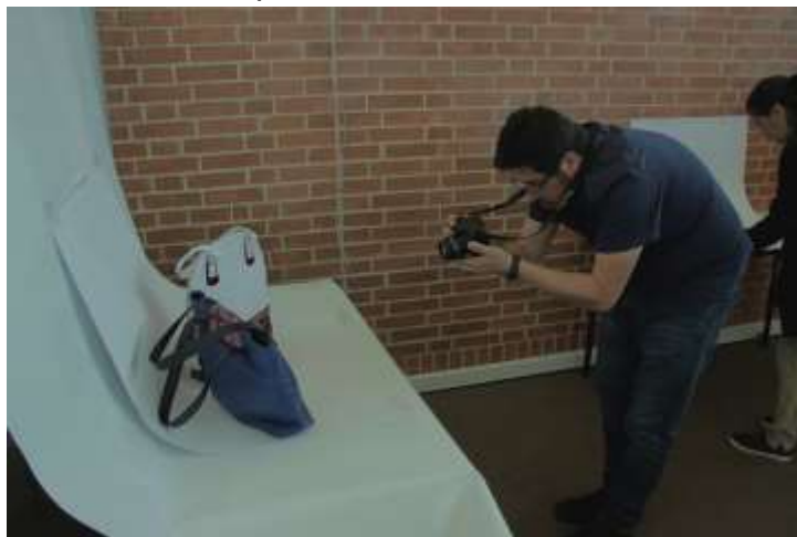
Toma de fotografías de producto, Jornada 1 de evaluación de producto