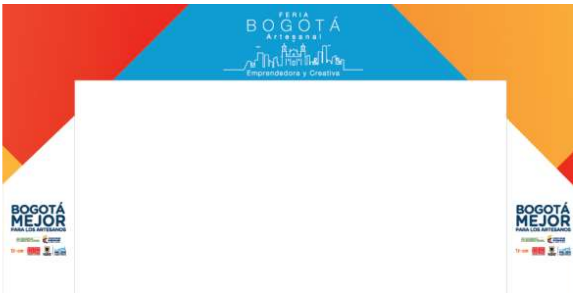
Arco del pórtico