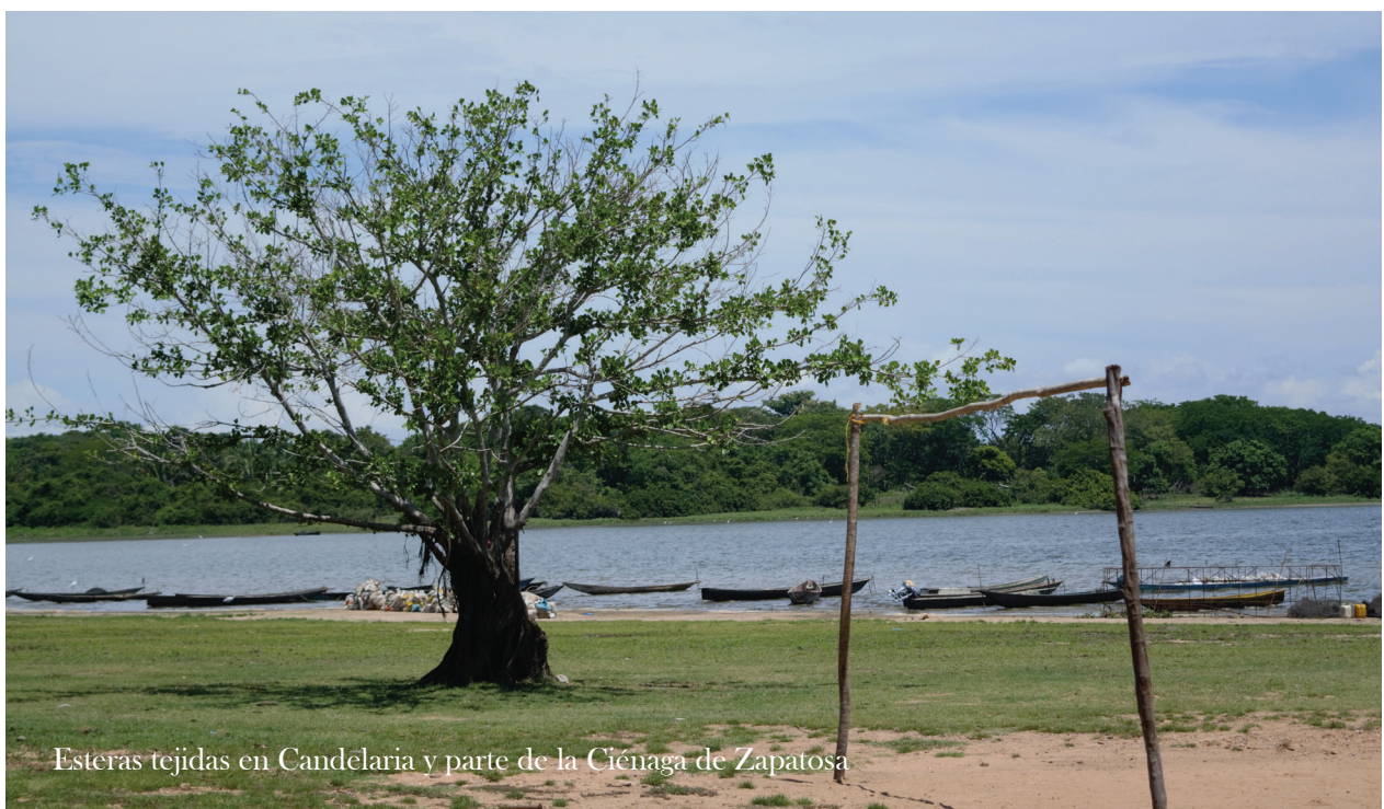
Esteras tejidas en Candelaria y parte de la Ciénaga de Zapatosa