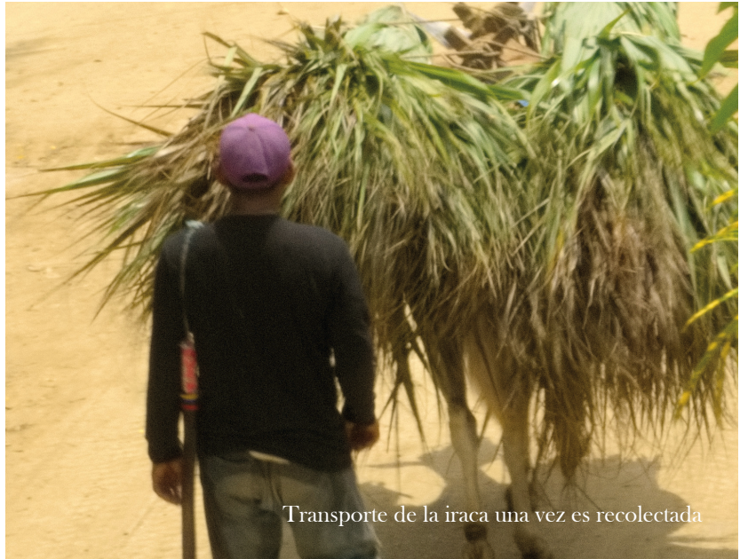
Transporte de la iraca una vez es recolectada