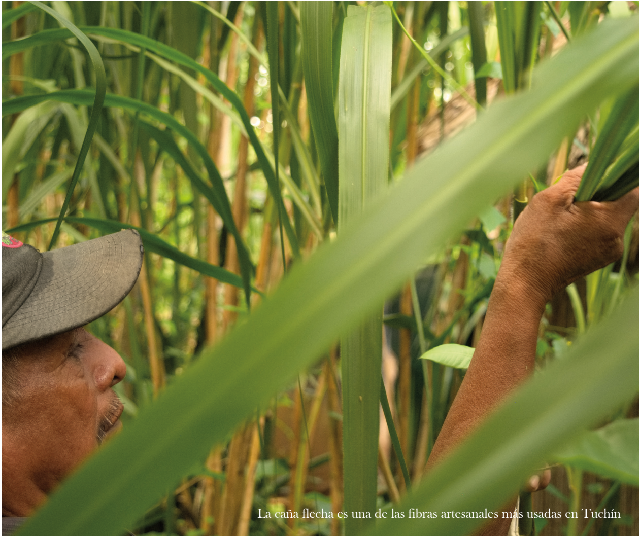
La caña flecha es una de las fibras artesanales más usadas en Tuchín

ciendo. Compraron herramientas cada vez más sofisticadas e hicieron mejores productos. Incluso, conformaron una organización, que luego llamarían Asociación de Artesanos del Cariñito, y desde allí continuaron vendiendo sus artesanías.