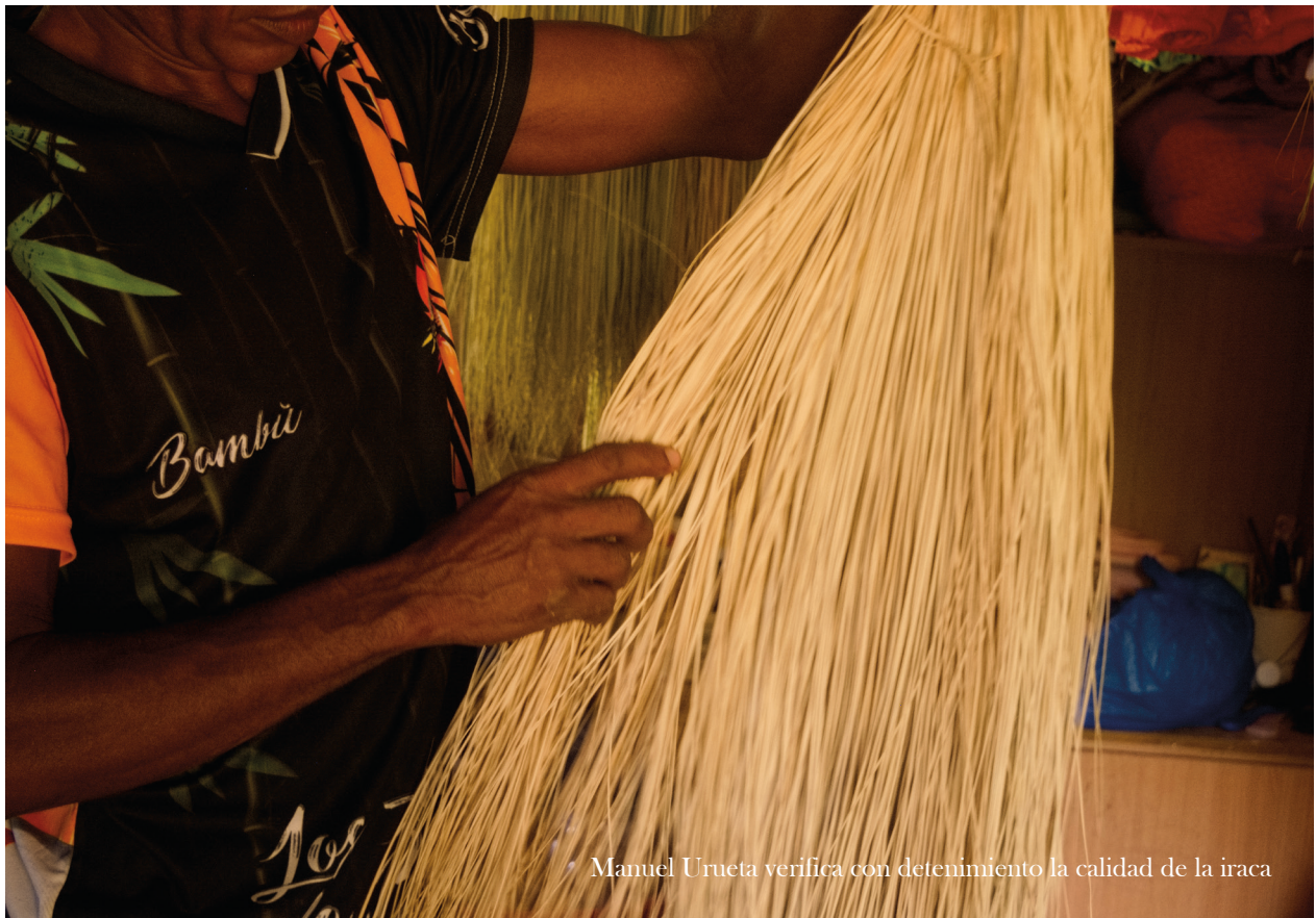
Manuel Urueta verifica con detenimiento la calidad de la iraca